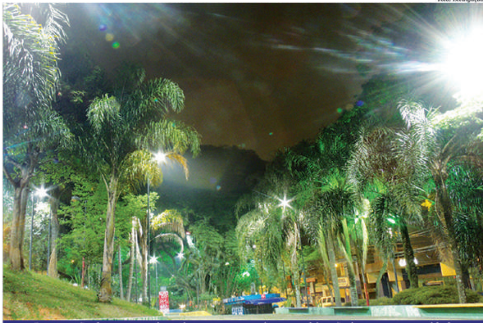
Preservação de parques, rios, córregos e outras áreas também são importantes na cidade

JOP - Em 2005, quando vereador, você fez um projeto de lei, aprovado no ano seguinte, para que a cidade se responsabilizasse pela preserva-