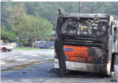
Ônibus da empresa Suzantar foram queimados no último sábado, em seu primeiro dia de circulação pela cidade de Mauá. Serviço de transporte público segue tumultuado na cidade.