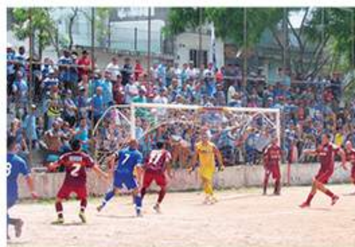
A Arena Bordô ficou lotada