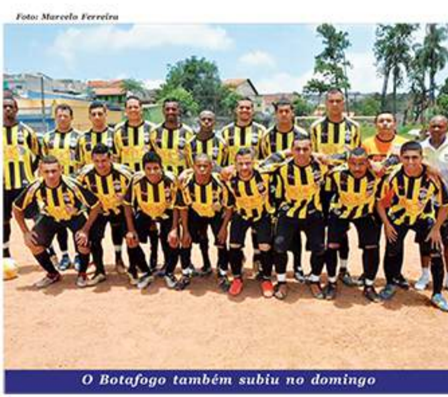
O Botafogo também subiu no domingo

Paulista de Futebol. Com o resultado a equipe foi eliminada da competição. A partida aconteceu no estádio Dr. José Lancha Filho, em Franca.