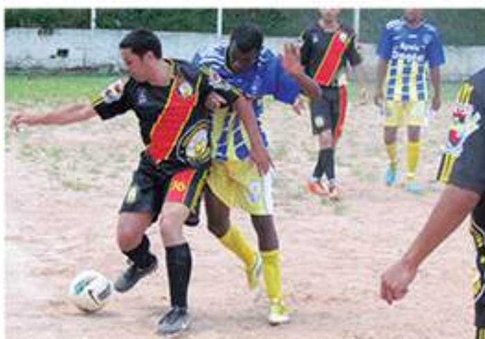
Maria Aparecida 3 x 1 Vira Copos