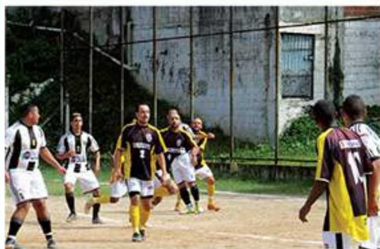
Central 1 x 1 Santa Tereza

26 jogos deram início à tradicional competição do futebol amador de Mauá