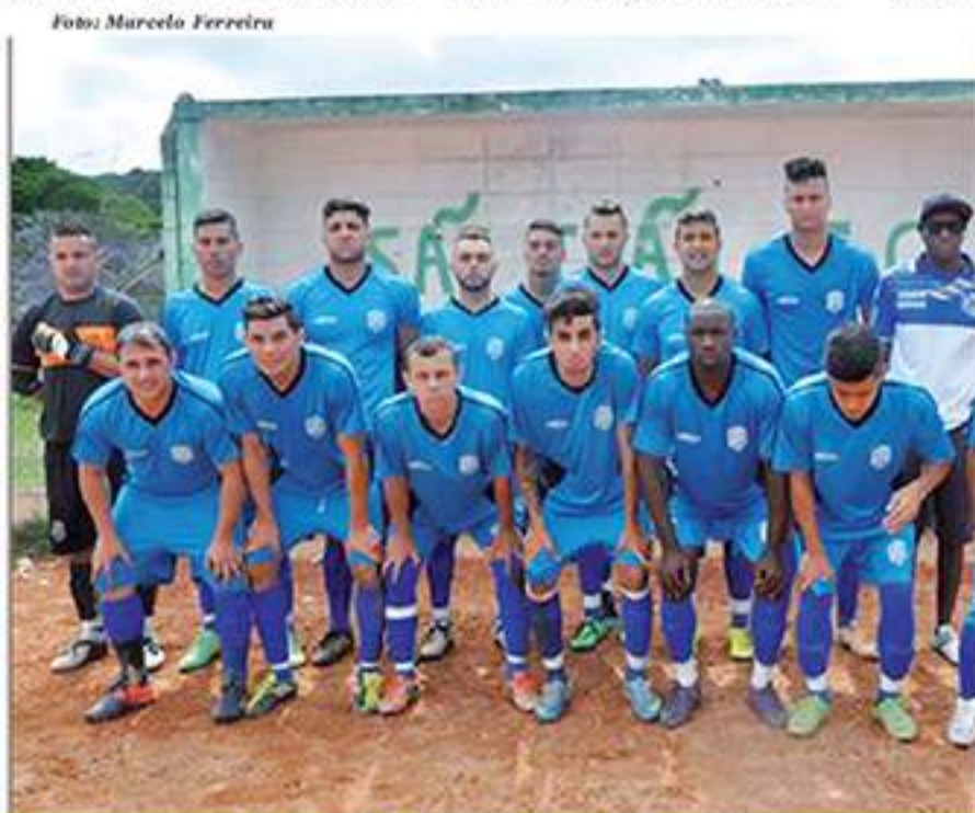
O Barroca chegou à Série Prata

Paulista de Futebol. Com o resultado a equipe foi eliminada da competição. A partida aconteceu no estádio Dr. José Lancha Filho, em Franca.