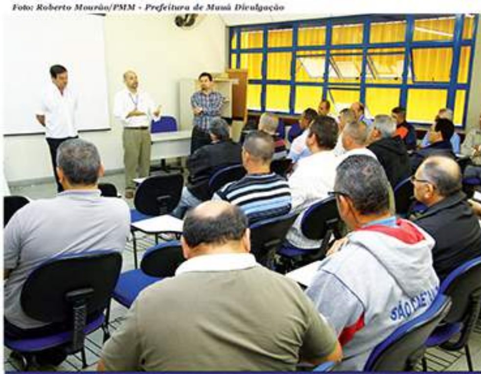
350 motoristas e 260 cobradores da Suzantur passarão pelo treinamento, previsto até 2015