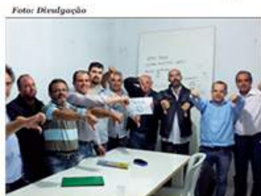
Grupo organiza manifestações