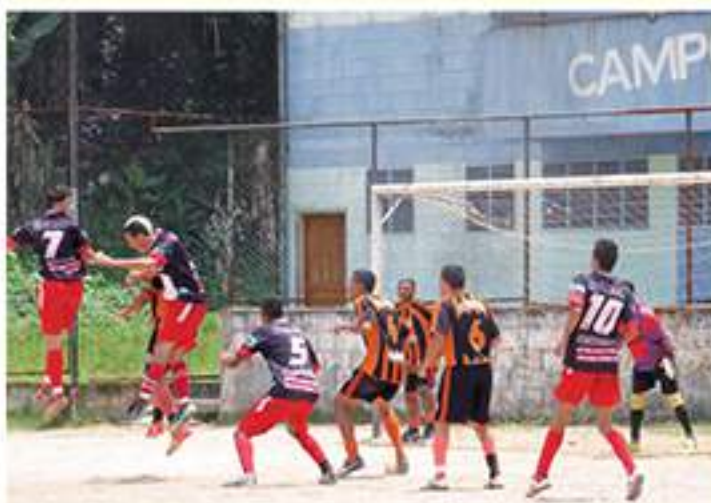
Santa Rosa 1 x 0 Deportivo