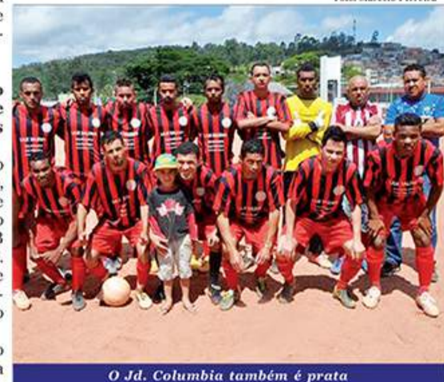
O Jd. Columbia também é prata

Paulista de Futebol. Com o resultado a equipe foi eliminada da competição. A partida aconteceu no estádio Dr. José Lancha Filho, em Franca.