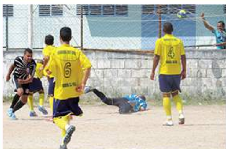
Corinthinas 1 x 0 Vila Suíça