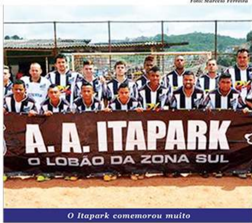
O Itapark comemorou muito

Paulista de Futebol. Com o resultado a equipe foi eliminada da competição. A partida aconteceu no estádio Dr. José Lancha Filho, em Franca.