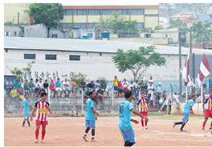
Mocidade 1 x 1 Vila Tavares