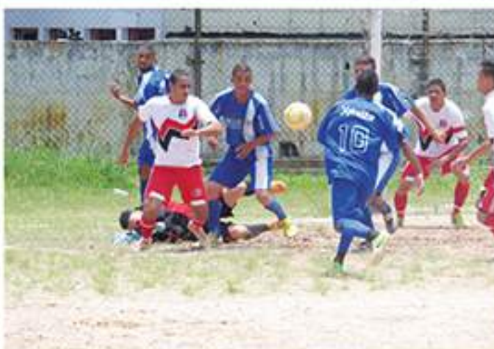
Santa Cruz 1 x 1 Atlas