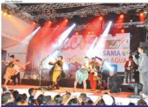
Grupo Teatro Mágico se apresenta no Festival ECOSS na sexta-feira, no Paço Municipal

• SIAV - Plano de Projeto para aquisição do Certificado Laboratório Qualidade de Água