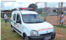
Anchilândia para desenvolvimento dos jogadores, em caso de necessidade. 2 anos das atividades da Divisão Especial em 2014

A última edição dos jogos contou com 450 participantes. Neste ano, a Secretaria de Cultura, Esportes e Lazer promove os jogos municipais como uma seleção para os Jogos Regionais do Idoso, marcados para o mês de maio em Oeiras. Os melhores colocados na disputa local se deslocarão para o torneio regional.