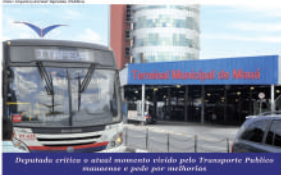
Deputada critica o atual momento vivido pelo Transporte Público municipal e pede por melhorias