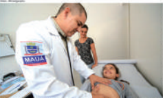
Mais médicos e profissionais no Programa Mais Médicos