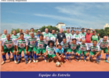
Equipe do Estrela

Profuturas da cidade com o Safesip (Sindicato dos Árbitros de Futebol do Estado de São Paulo), que fará a escala de árbitros para as competições do município. Em contrapartida, a entidade será responsável pelos custos com enfermeiros e motoristas de carro de socorro, que fará sua estreia no campo de