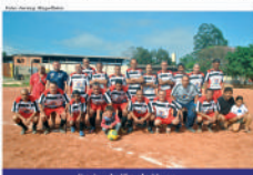
Equipe do Flor do Meio

Profuturas da cidade com o Safesip (Sindicato dos Árbitros de Futebol do Estado de São Paulo), que fará a escala de árbitros para as competições do município. Em contrapartida, a entidade será responsável pelos custos com enfermeiros e motoristas de carro de socorro, que fará sua estreia no campo de