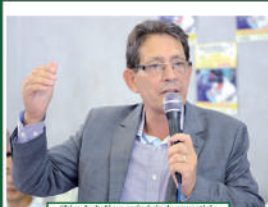
Chico do Judô na cerimônia de competição.

São disputadas 20 modalidades entre as quais tradicionais, como futsal, judô, vôlei, basquete e atletismo, passando pelo xadrez, tênis de mesa e aquelas voltadas aos alunos com deficiência física, intelectual e visual. A disputa abrange os níveis infantil e juvenil, compreendendo quatro categorias: pré-infantil, até 12 anos; infantil, até 14 anos; infantil, até 17 anos; e juvenil, até 18 anos.