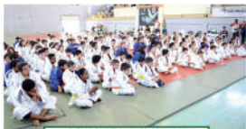
Judocas sentados na primeira etapa.