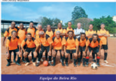
Equipe do Beira Rio

Profuturas da cidade com o Safesip (Sindicato dos Árbitros de Futebol do Estado de São Paulo), que fará a escala de árbitros para as competições do município. Em contrapartida, a entidade será responsável pelos custos com enfermeiros e motoristas de carro de socorro, que fará sua estreia no campo de