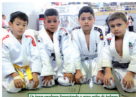
Os Jogos Escolares favorecendo a nova geração de judocas.