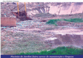
Piscinão do Jardim Zaira carece de manutenção e limpeza