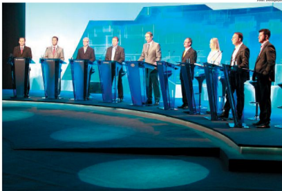
Debate juntou os oito candidatos a Prefeitura de Mauá na manhã do último sábado e foi transmitido via TV, rádio e internet