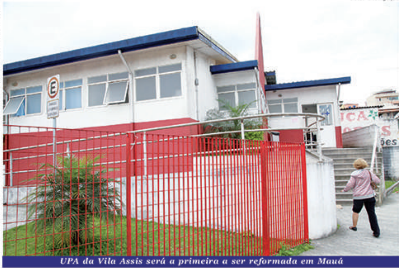
UPA da Vila Assis será a primeira a ser reformada em Mauá