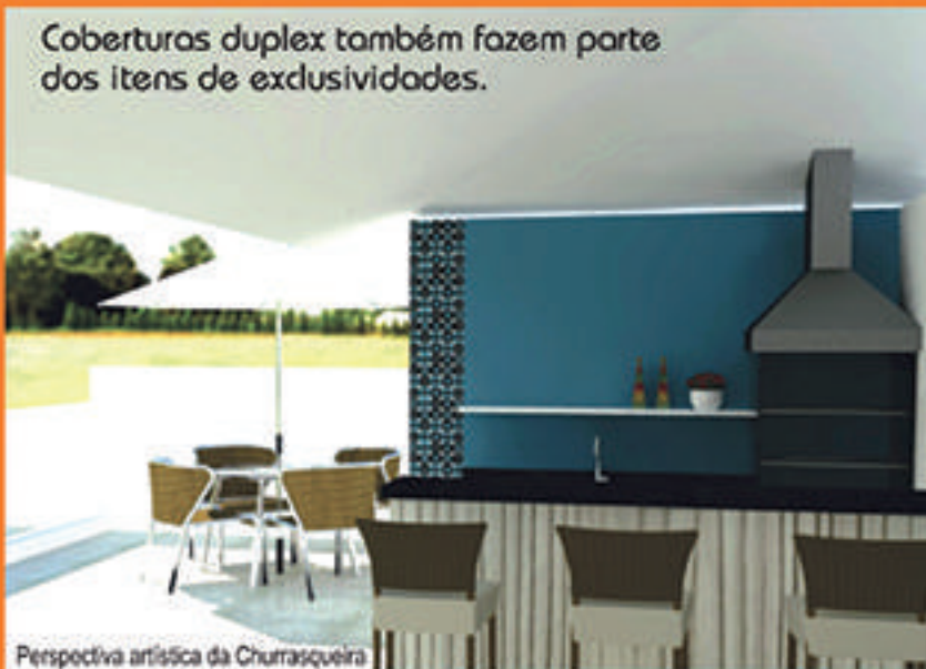
Perspectiva artística da Churrasqueira

Coberturas duplex também fazem parte dos itens de exlusividades.