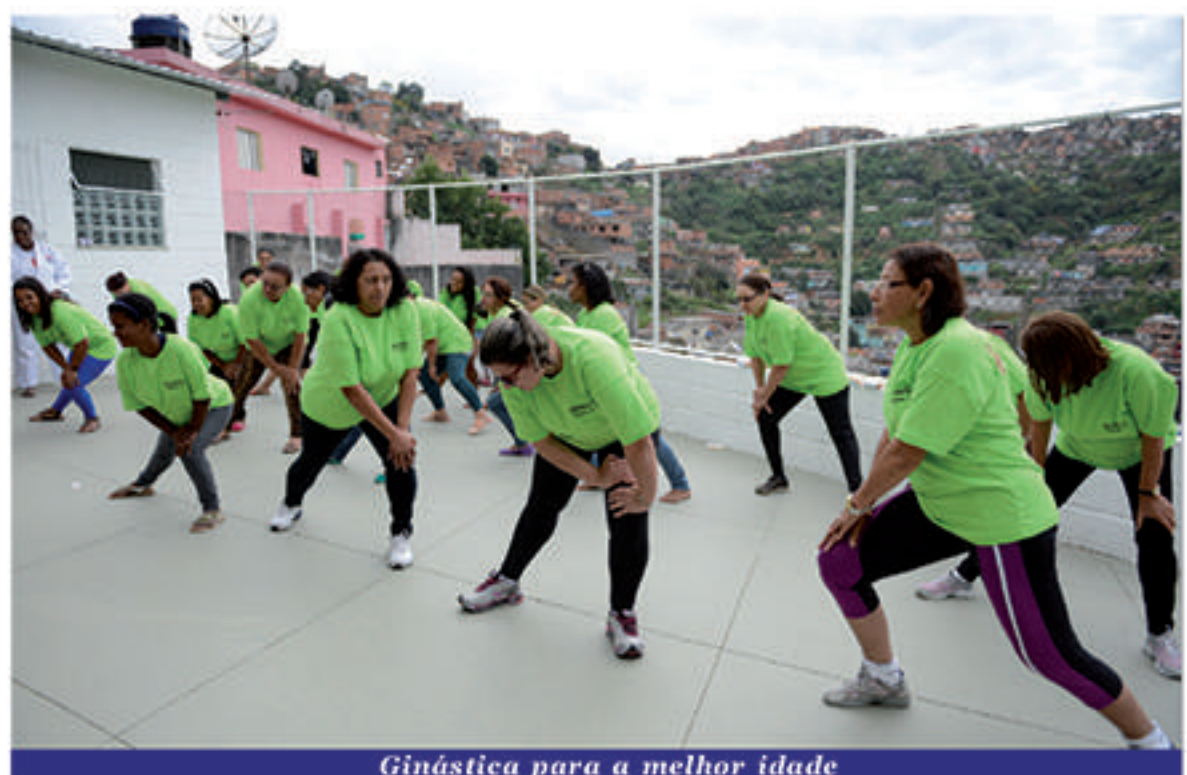
Ginástica para a melhor idade