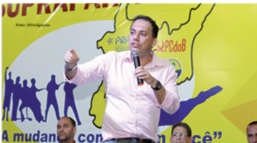
Pré-candidatura de Atila Jacomussi foi lançada na última sexta-feira (2)