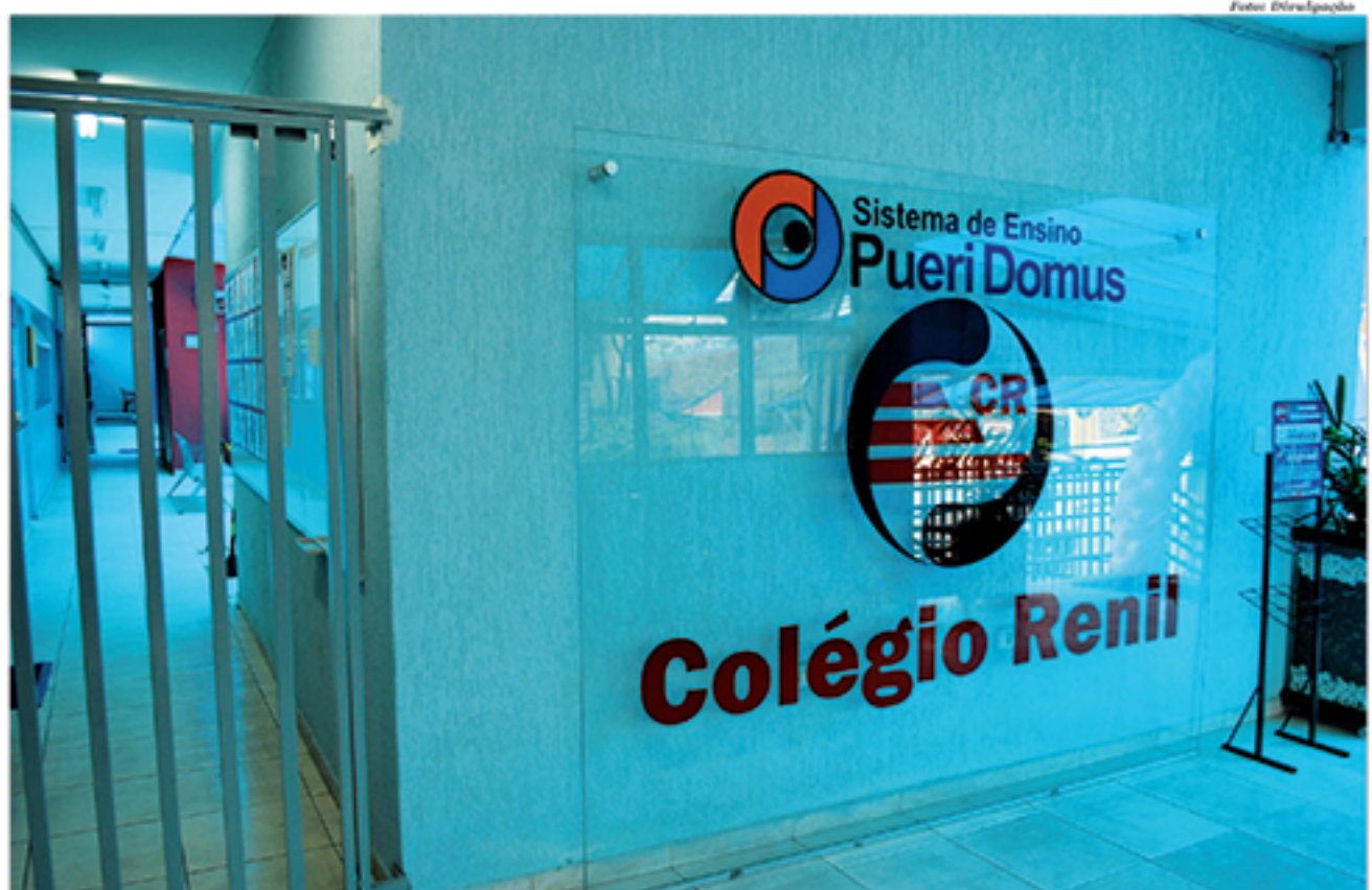
Sistema Pueri Domus já está implantado no Colégio Renil. Primeiras turmas iniciarão as aulas em 2016