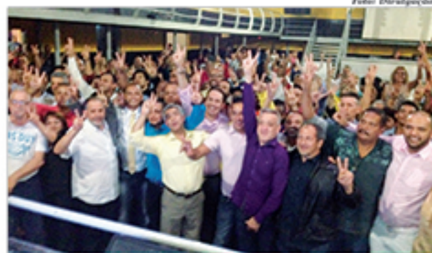
Deputado recebeu apoio maciço durante ato suprapartidário

O lançamento da pré-candidatura ocorreu em