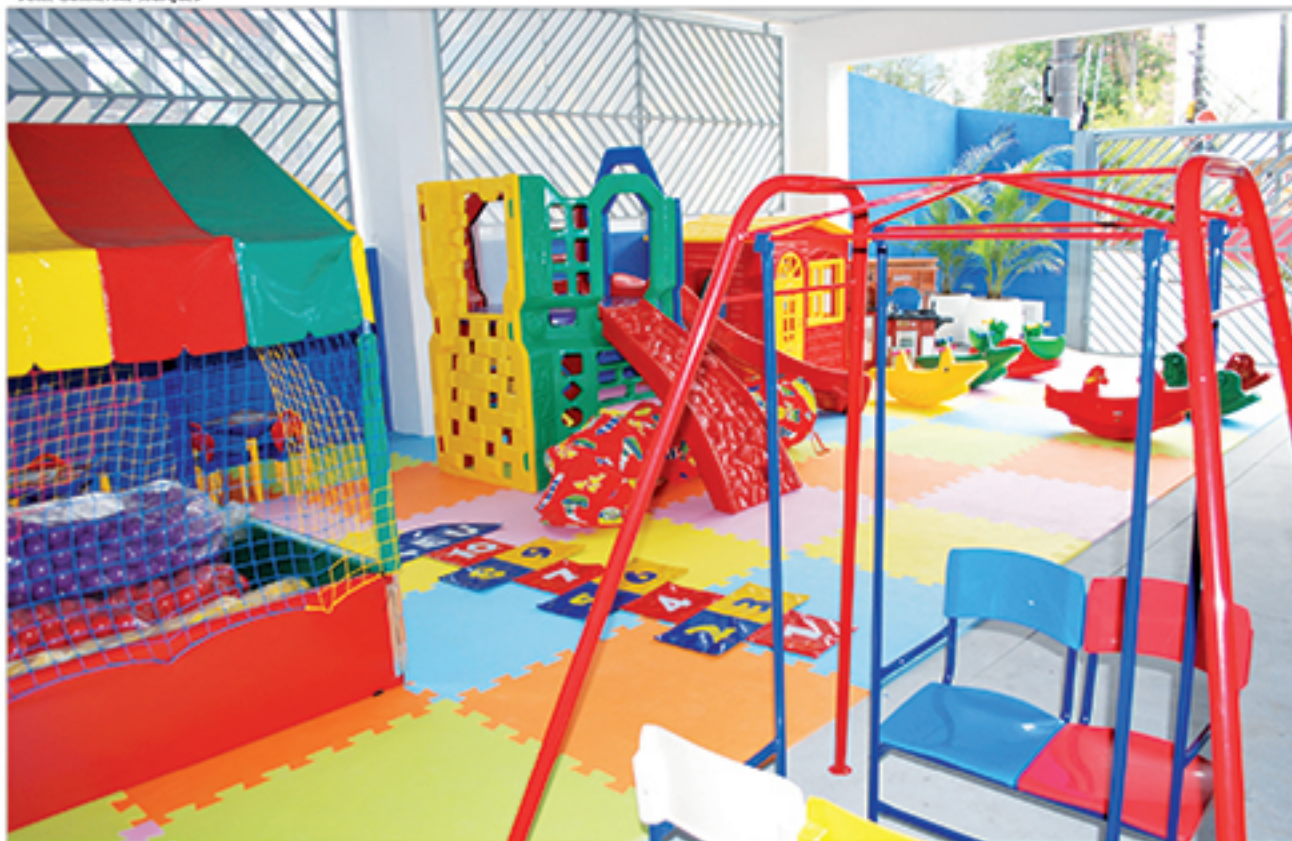
Playground é uma das áreas que compõem a ampla estrutura oferecida pelo Colégio Renil