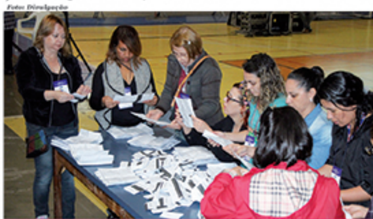
Apuração com resultados da eleição foi divulgada na segunda-feira (5)