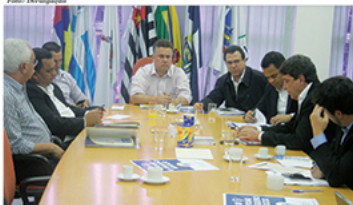
Prefeitos das sete cidades do ABC se reuniram na segunda-feira

Leve para sua família paz e saúde mental, moral e transcendental Leia os livros do psicanalista cristão