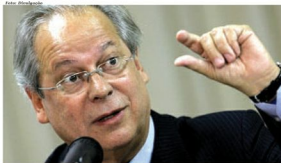
José Dirceu foi condenado a 10 anos e 10 meses de prisão em regime fechado