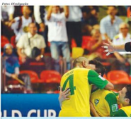
Seleção Brasileira sofreu mais pressão pela Argentina. Agora, terá a Colômbia pela frente