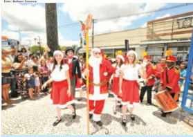
Acompanhado das noleteras, Papai Noel estará no shopping todos os dias