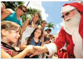
Papai Noel chegou ao Mauá Plaza no último domingo (11) e fez a festa das crianças

Além do clima natalino, o Mauá Plaza Shopping