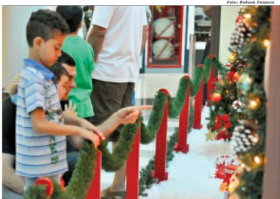
Crianças já visitam Shopping e se encantam com nova decoração

tem outras ações. Uma delas é a presença do Papai Noel desde o último domingo (11). O bom velhinho estará presente no shopping, ouvindo os pedidos e tirando fotos com as crianças, todos os dias, de segunda a sábado das 10h às 22h e aos domingos e feriados das 14h às 20h, até o dia 24 de dezembro, acompa-