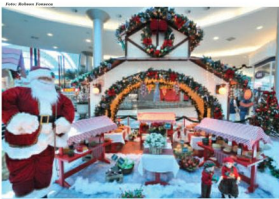
Decoração do Mauá Plaza já está em clima natalino. Há várias novidades