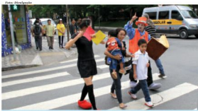
Campanha deverá durar até o dia 19 de dezembro. Ações são diárias