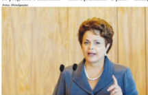
Dilma Rousseff divulgou as novas medidas no último dia 8