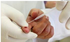
A partir do dia 22, testes de HIV e outras DSTs serão intensificados na cidade