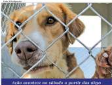
Ação acontece no sábado a partir das 9h30