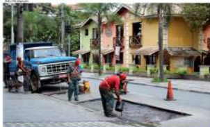
Ações como operações 'Tuga Barroca' estão sendo realizadas em Ribeirão Pires.