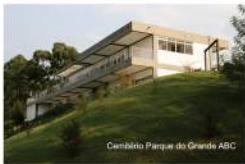
Cemitério Parque do Grande ABC

Não deixe de nos visitar, afinal, quem marca a sua vida não pode ser esquecido.