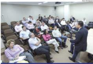
Domínguez Braga se reuniu com secretários para fazer balanço de gestão até o momento.

O CEO das obras e obras de Mauá, que já estão em construção no Parque das Américas foi outro assun-