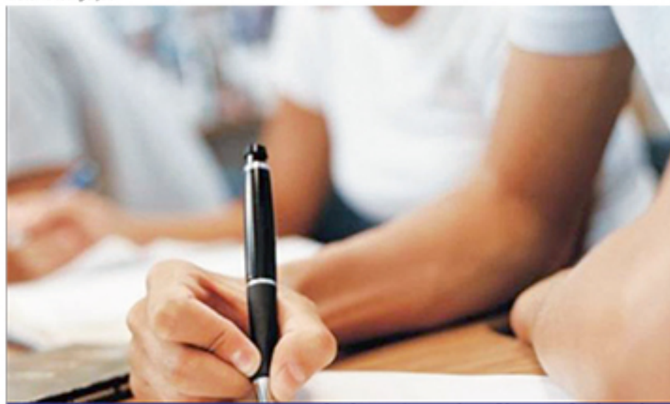
Inscrições para o processo seletivo vão até o dia 20 de janeiro