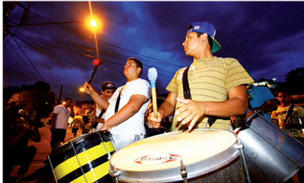
Desfiles das escolas de samba serão realizados nos dias 14 e 15 de fevereiro

União, este foi um momento de muita comemoração e expectativa: "Ficamos muito tempo sem Carnaval na cidade, e poder voltar contando com todo esse apoio é muito bom. Nossas agremiações trabalharam com muito afinco, e seguem assim até o último minuto, com a missão de fazer um gran-