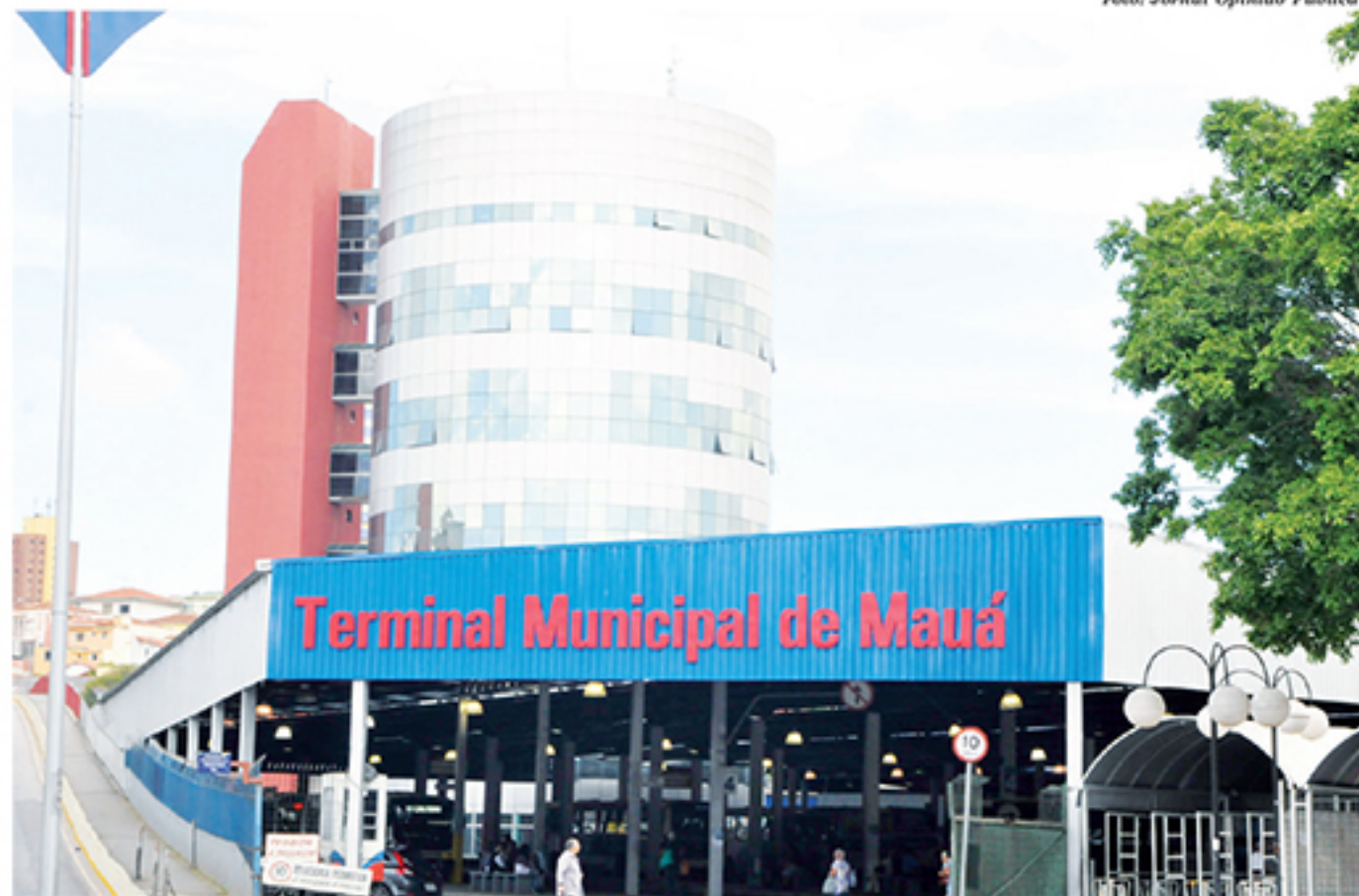
Tarifa do transporte público coletivo passou a ser de R$ 3,50. Munícipes insatisfeitos protestaram

As datas de vencimento para a cota única serão 19 de fevereiro e 16 de março. Para quem preferir pagar