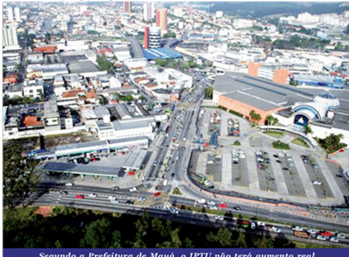
Segundo a Prefeitura de Mauá, o IPTU não terá aumento real