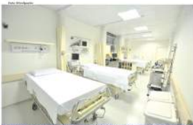
Pronto Atendimento em Ortopedia, funciona de segunda a sexta-feira, das 7h às 19h