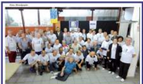
Equipe de Bocha de Mauá conquistou bons resultados no JOTISA