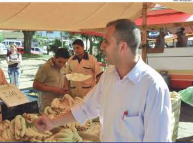
Ozelito planeja voltar à política no futuro, mas resolve que quer dar um passo de cada vez