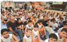
Prefeito Donisete Braga prestigiou encontro de basquete em Mauá