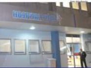
Hospital Vital fica localizado na Vila Anchieta

Em andamento, está a conclusão do primeiro Centro de Hemodiálise da cidade, onde será possível fazer procedimentos importantes, como cateterismo cardíaco e outros. "O serviço ainda não