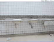
Banheiros do ginásio também estão em más condições. Área será a primeira a ser reformada

Também não existe um espaço específico para a imprensa, como uma cabine, de onde poderiam ser transmitidos os eventos que o local recebe.