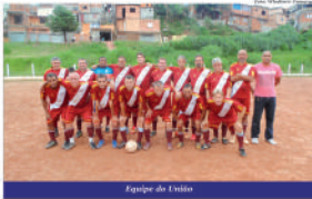
Equipe do Urúko

Somente o campo do Urúko recebeu um jogo no domingo. Os donos da casa venceram o E. C. Dinamarco por 2x0. A outra partida que estava marcada para lá, entre Dragões Nova