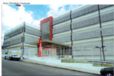
Após interlocação da deputada, junto ao presidente do Fiesp, Mauá ganha unidade do Senai

Além disso, o departamento de Saúde foi contemplado com R$ 6,5 milhões para redequação e reforma e mais R$ 2 milhões para o centro mental. As verbas estaduais foram liberadas graças ao esforço da parlamentar.