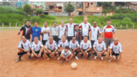
Equipe do Archêda