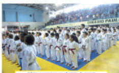
Atletas se aquecendo na abertura do torneio.