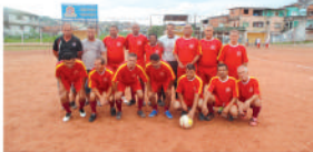
Equipe do Itapeva

Os campos do América e do São João também receberam suas rodadas duplas. No campo do América o Colênia superou o Aguaré por 2x0 enquanto o C. A.