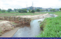
Piscinões não são limpos desde 2011, afirma a Prefeitura