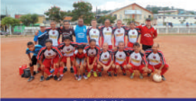
Equipe do Modidade

Al no campo no Estrela, a equipe do Parque da Amé-