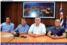
Fim da greve foi anunciado durante coletiva de imprensa