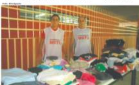
Coordenadores distribuíam doações no Jardim Feital, em Mauá