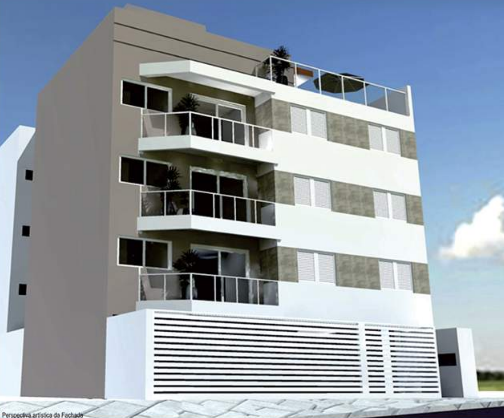
Perspectiva artística da Fachada

Um projeto exclusivo, com apartamentos 2 dorms/suíte, em um lugar tranquilo, gostoso de morar. Por um preço que vai surpreender você!