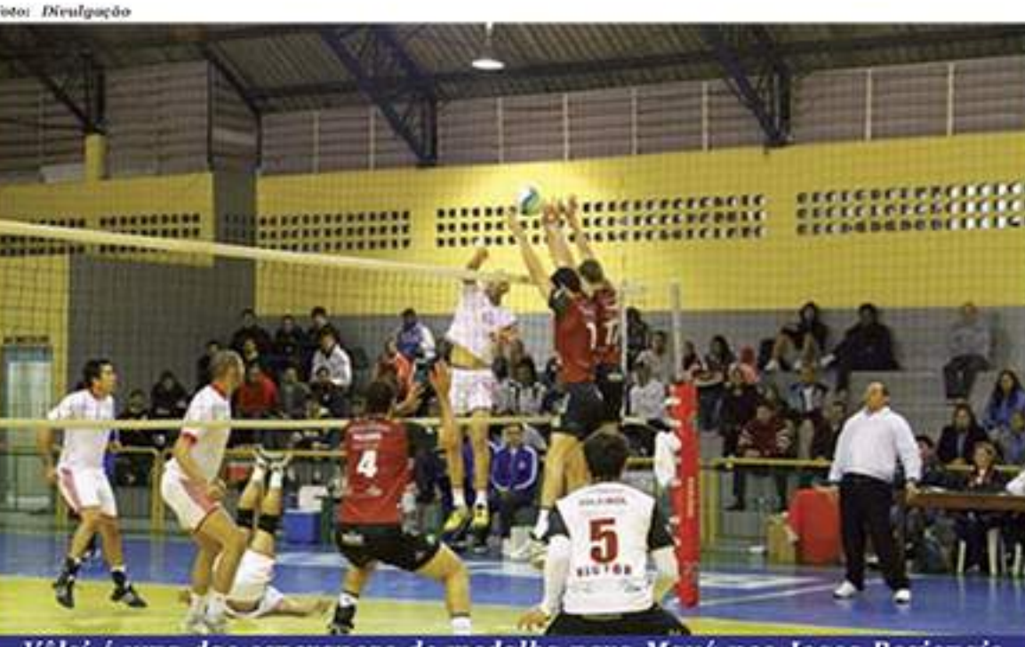
Vôlei é uma das esperanças de medalha para Mauá nos Jogos Regionais