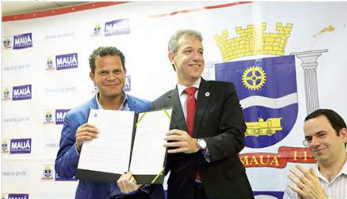
Arthur Chioro assinou termo para instalação da Faculdade de Medicina em Mauá em dezembro de 2014. Ministro da Saúde anunciou a instituição na última sexta-feira (10)