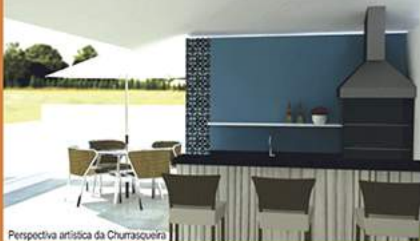
Perspectiva artística da Churrasqueira

Coberturas duplex também fazem parte dos itens de exclusividades.