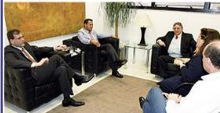
Reitor da Uninove se encontrou com o prefeito de Mauá. Instituição quer agilizar processo seletivo

Mesmo com o andamento da fase de apresentação de recursos, que se encerra em 22 de julho, e com o resultado final sendo publicado em 28 de agosto, a Uninove trabalha com a meta de lançar o vestibular ainda este ano. Nos próximos dias serão promovidos ao menos três novos encontros. No primeiro deles, executivos da universidade vão visitar os equipamentos de saúde da cidade, no segundo está prevista uma visita da equipe técnica da Secretaria Municipal da Saúde às instalações da Uninove, e no terceiro, agendado para Brasília, haverá a participação dos ministros Renato Janine, da Educação, e Arthur Chioro, da Saúde.