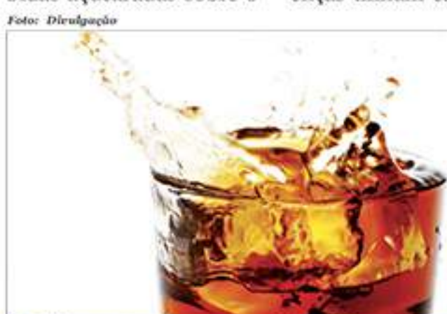
Refrigerantes causam mais de 180 mil mortes por ano, segundo estudos