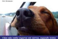
Cães não estão seguros em carros, segundo testes