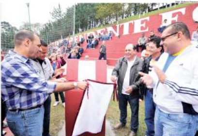
Campo com gramado sintético do Independente F. C. foi planejado por mais de seis meses antes de construção