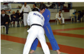
Delegação mauaense deverá levar 270 atletas em 27 modalidades nos Regionais

*Modalidades que terão participação tanto do masculino quanto do feminino