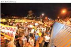
Manifestantes percorreram várias ruas da cidade na sexta-feira