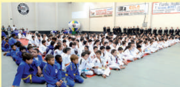
Atletas e árbitros que atuaram na 5ª etapa dos Jogos Escolares realizado em Mauá

A cidade de Mauá sediou a quinta etapa dos Jogos Escolares 2014, modalidade judô, evento promovido pela Secretaria de Esportes, Lazer e Juventude do Estado de São Paulo.