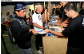
Cerca de 300 pessoas participaram das duas primeiras reuniões do OP em Mauá.

Os melhores Ingredientes, O Melhor Sorvete.