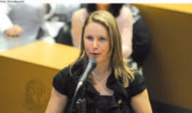
Se for sancionada, nova lei deverá entrar em vigor em 90 dias