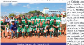
Equipe Master do Ouso Verde

Nas outras duas partidas válidas pelo chave, o Moridade F. C. venceu o Al. Hilda F. C. por 4x0 enquanto a A. A. Bela Vista também venceu por 2x0 pelo Pedreira F. C. A equipe segue na