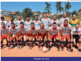
Equipe do Jui

lanterna do grupo, sem ter pontuação ainda.