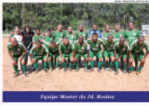
Equipe Master do Al. Rosário

Pelo grupo B, Estrela, Sereno, Ouro Verde, Anchieta e União já estão classificados, enquanto Beira Rio e Flor do Morro brigam pela última vaga. No sábado, o Flor do Morro enfrenta o Estrela, fora de casa, prestando de