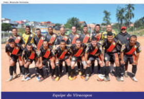
Equipe do Virosoyos

terramentamente, um lugar no segundo fase do campeonato. Ao todo, cinco equipes de cada grupo, além da melhor sexta colocada por índice técnico. Quem os três times de pior campanha em cada grupo, além do pior sétimo classificado por índice técnico.