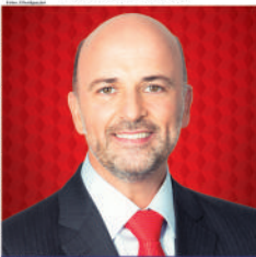
Projeto visa facilitar condições para que idosos possam desfrutar de viagens

"O aumento da expectativa de vida dos brasileiros traz à tona a nova realidade do demandas sociais quanto à percepção de tudo o que resulta em qualidade de vida. A terceira idade representa um importante segmento no mercado de consumo nacional, inclusive no mercado