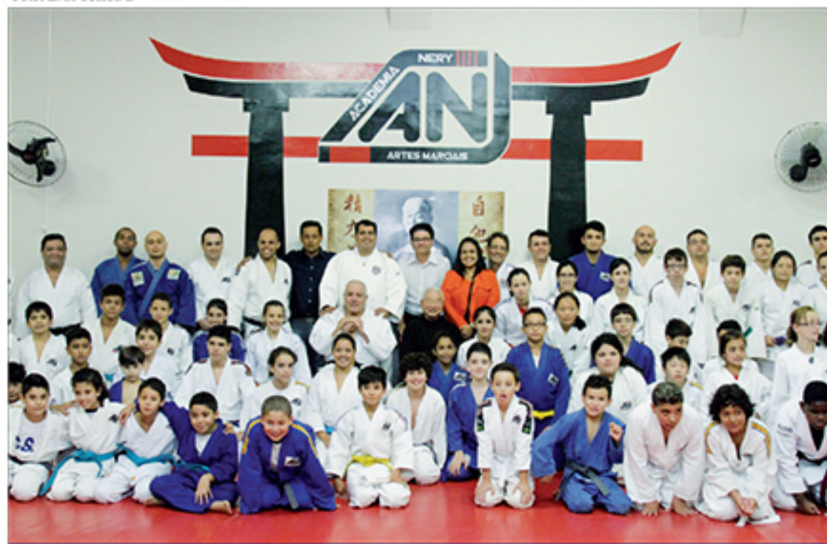
Professores, autoridades e judocas do dojô Nery

viabilização de recursos para o desporto de nossa cidade, este encontro permite que o nosso secretário conheça e se sensibilize com as nossas dificuldades na pasta do esporte."