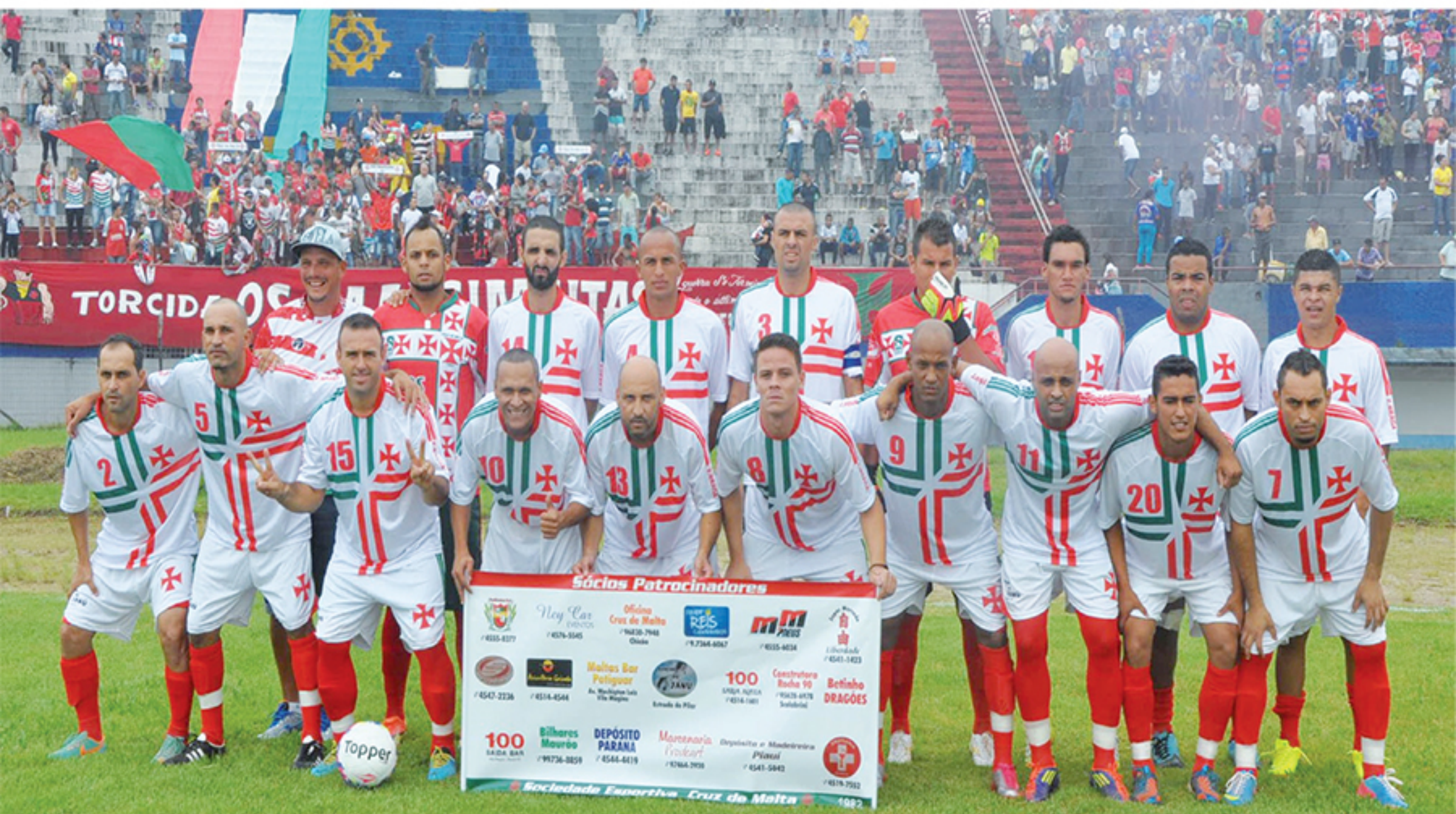
S.E. Cruz de Malta - Campeão da 8ª Copa Ivan - 2015