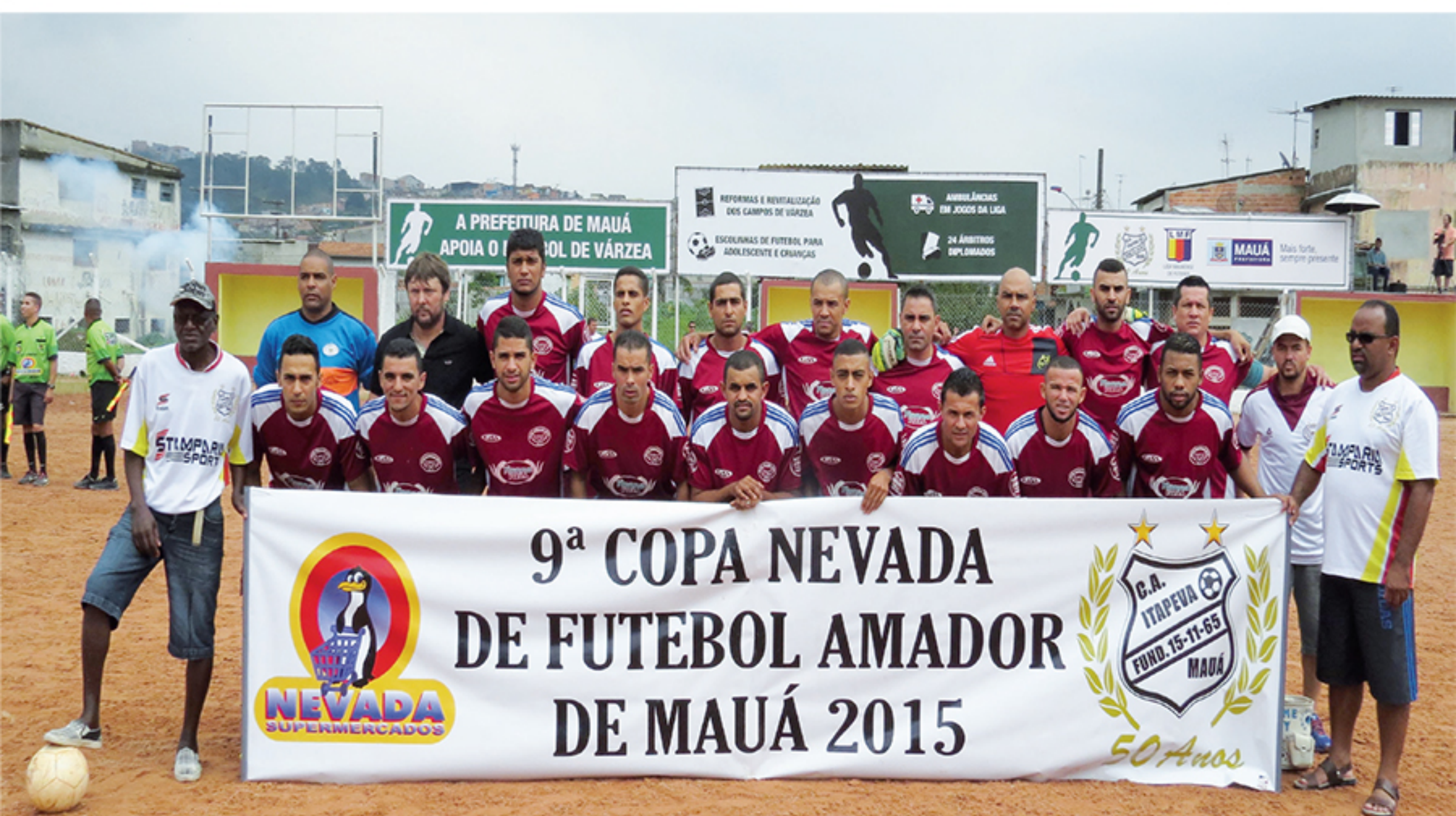
C.E. União P.S.V. - Campeão da 9ª Copa Nevada - 2015