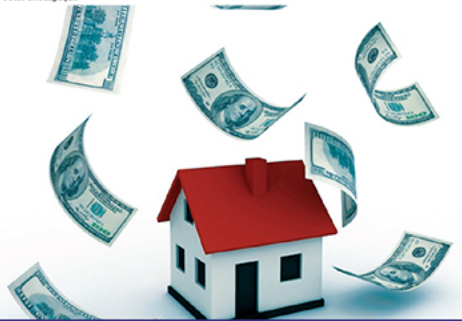
Contribuintes têm até o dia 27 para quitar IPTU em Ribeirão Pires