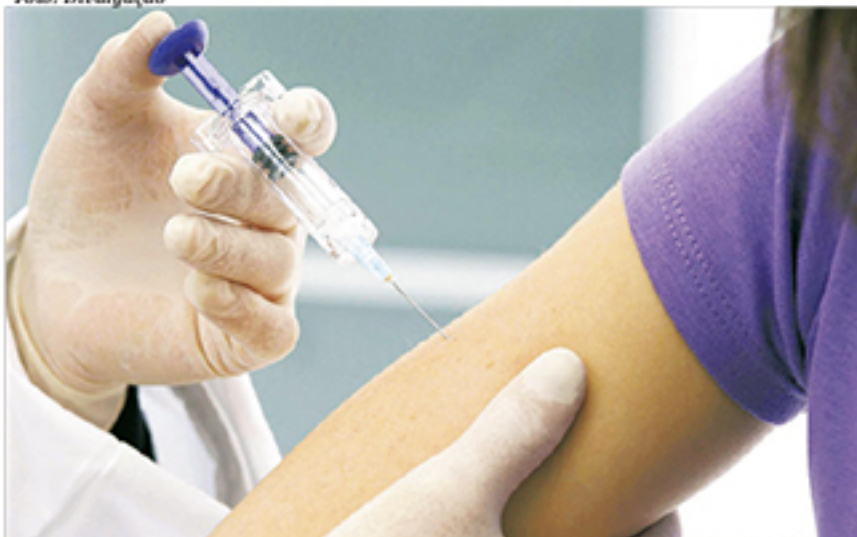
Vacinação contra o HPV prossegue até o dia 10 de abril em Mauá