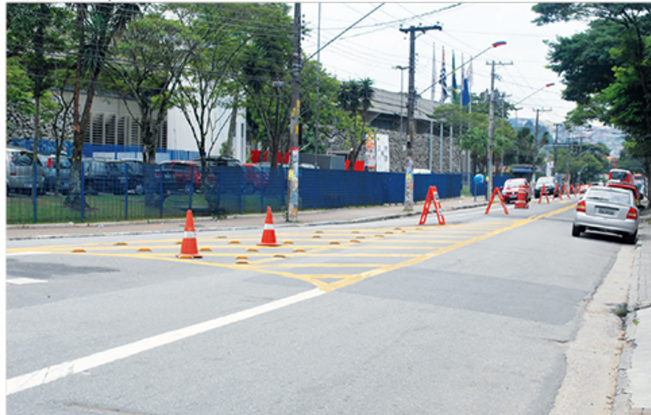
Comerciantes não concordam com implantação de faixa exclusiva de ônibus na Avenida Castelo Branco