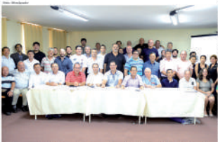
Dirigentes da FPJ, delegados e recursos das 16 direções regionais do judô paulista

18 de janeiro, nas dependências do Pampas Palace Hotel, em São Bernardo do Campo.