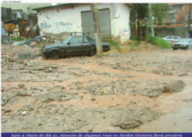
Após a chuva do dia 21, situação de algumas ruas no Jardim Oratório ficou precária