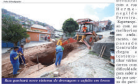
Rua ganhará novo sistema de drenagem e asfalto em breve