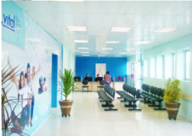
O Hospital também deixará operar, em breve, atendendo outros convênios e particulares