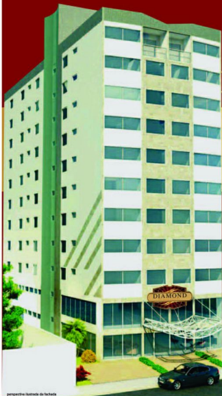
perspectiva lateral da fachada

O DIAMOND PLAZA HOTEL está com obras em ritmo acelerado e SERÁ ENTREGUE TOTALMENTE MOBILIADO, ANTES DA COPA DE 2014.