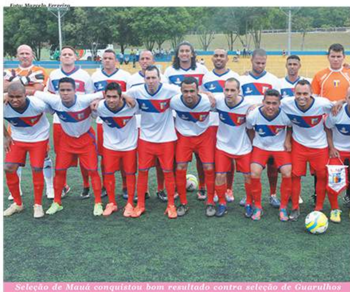
Seleção de Mauá conquistou bom resultado contra seleção de Guarulhos