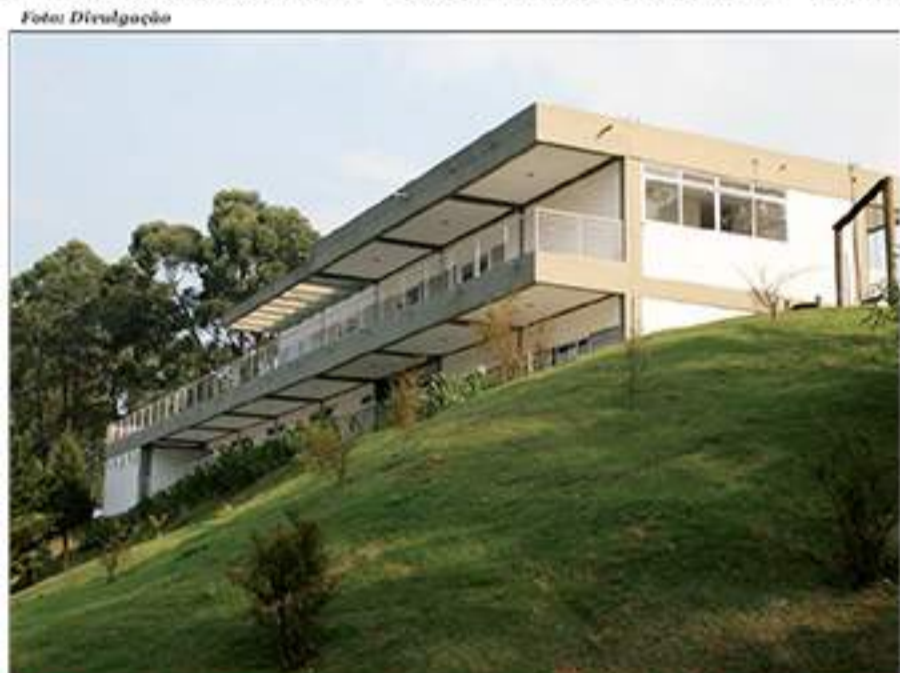
Cemitério Parque do Grande ABC segue em busca de melhorias estruturais com novos projetos