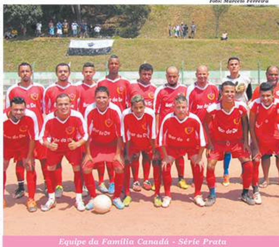
Equipe da Família Canadá - Série Prata