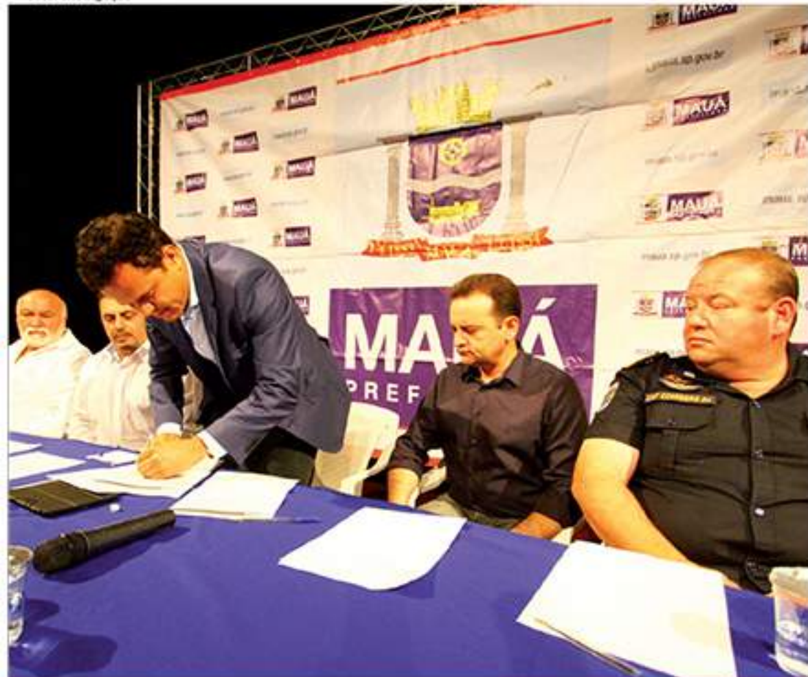
Estatuto é mais uma conquista da Guarda Civil Municipal de Mauá. Neste ano, a GCM já havia recebido novos equipamentos e veículos

VENHA CONHECER A MELHOR ESTRUTURA DO ABC