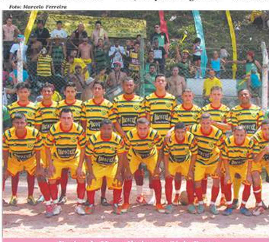
Equipe do Mary Jhames - Série Prata