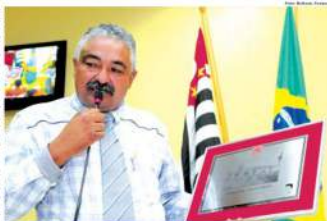
Encontro ocorreu para que MSTU homenageasse os governos pela parceria na construção de apartamentos populares para população de baixa renda em Mauá