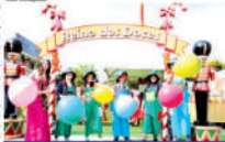
Preparativos para Festival do Chocolate já se iniciaram