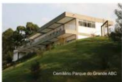
Cemitério Parque do Grande ABC

Não deixe de nos visitar, afinal, quem marca a sua vida não pode ser esquecido.