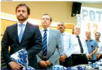
Governos Federal, Estadual e Municipal foram representados na ocasião