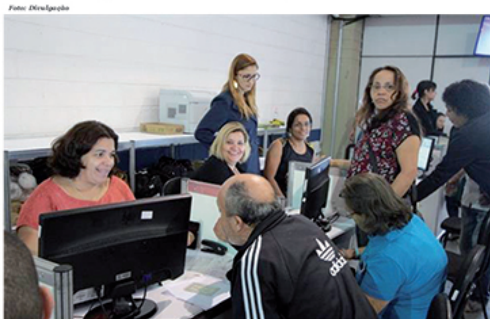
Quem ainda não quitou seus débitos com a administração municipal tem até o dia 15