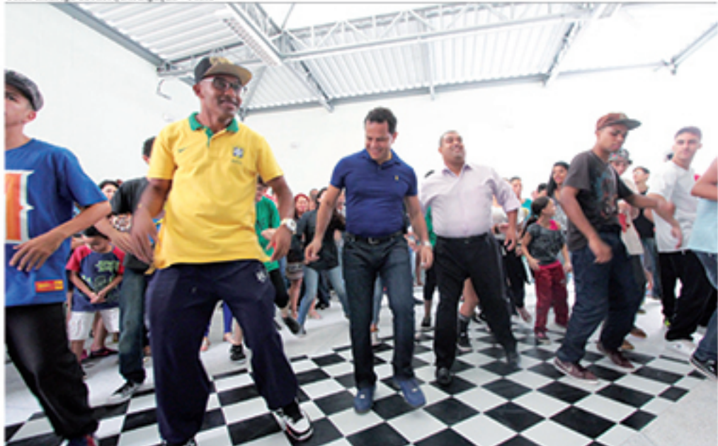
Casa do Hip Hop é o novo espaço multiuso da cidade