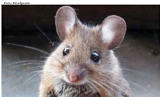
O método não usa animais como cobaias