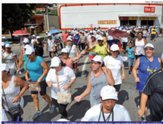
Dentre as ações que ocorrerão durante o ECOSS estão o ritual maracatu, com participação dos municípios

Em 2013, a SAMA juntamente com empresas parceiras, trabalhou em conjunto com o governo do atual prefeito Braga para apresentar à população da cidade, inúmeras atividades para todos os gostos que poderiam ser conferidas no mês de março, com o objetivo de convidar os municípios a tor um sorriso para o seu pequeno planeta e chamar a atenção.