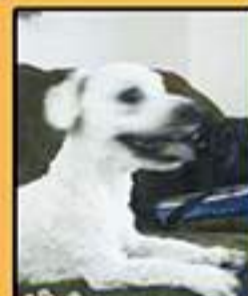
CRIANÇA DOENTE !