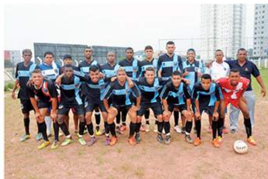
O Unidos do Miranda é um dos classificados para a segunda fase da Copa Lourencini

9h – Unidos do Miranda x Águia São Jorge 10h30 – Vira Copos x América do Parque