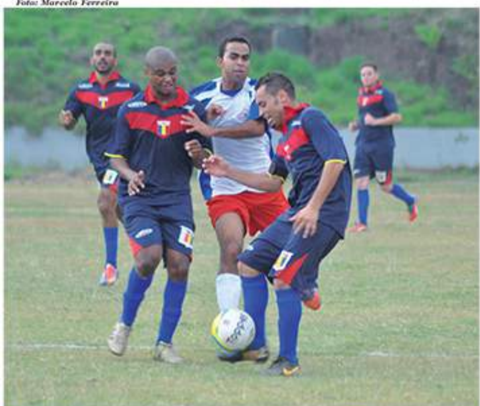
Seleção Mauaense fez jogo complicado contra seleção de Guarulhos

As finais da Série Prata acontecerão neste domingo (9) no estádio municipal Pedro Benedetti. Além da decisão da Prata, a Série Ouro também terá sua finalíssima neste domingo, também no estádio municipal, entre Maria Aparecida e Vera Cruz.