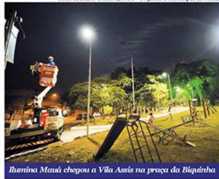
Ilumina Mauá chegou a Vila Assis na praça da Biquinha