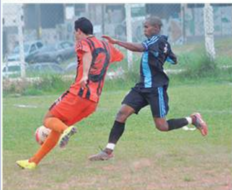
Lance de Unidos do Miranda x São Jorge

Com oito jogos em três campos terá início a Segunda Fase da Copa Lourencini de Futebol 2014. No entanto a Série Prata do torneio (reescalonagem) aguardará mais uma semana para início devido a questões de ordem disciplinar que a Organização está resolvendo.