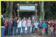
Moradores comparecem à inauguração e comemoram benfeitoria em ponto tradicional do bairro.

Segundo Atila Jacomussi a realização das revitalizações será um marco histórico na cidade. "Acredito que um gestor público tem que pensar ações que beneficiem a população de maneira coletiva" , afirma Atila.