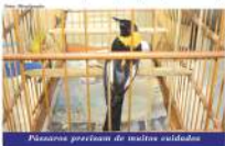
Pássaros precisam de muitas cuidados