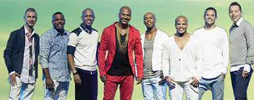
TURMA DO PAGODE