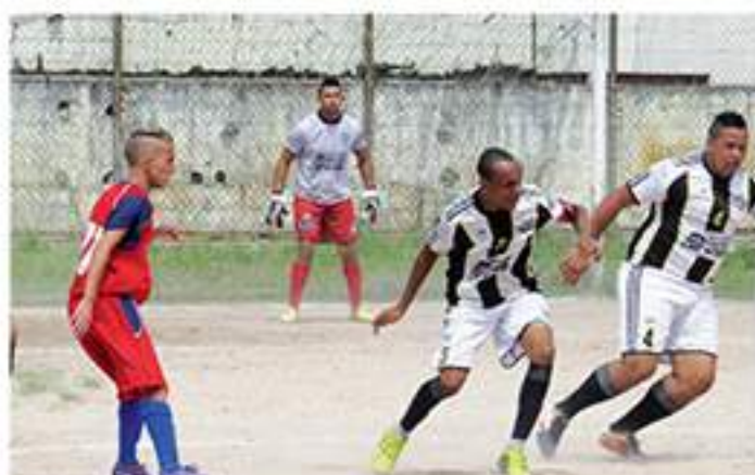
O Central venceu bem por 1x0