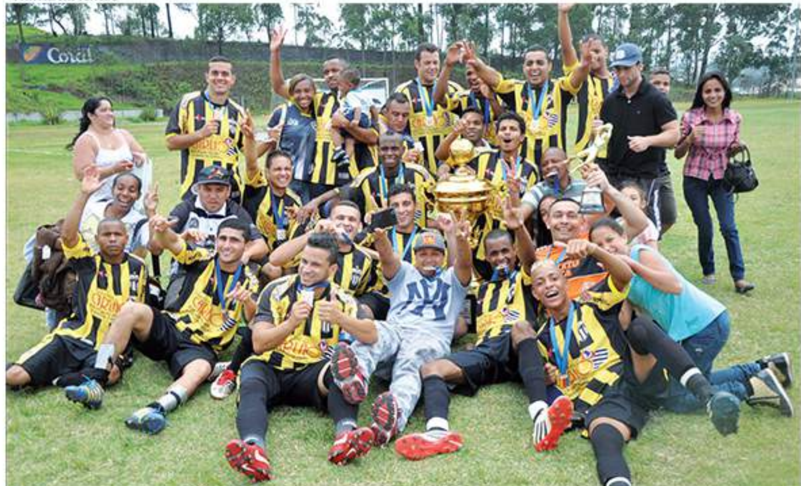
Botafogo coroou o acesso à Série Prata com o título da Terceira Divisão B