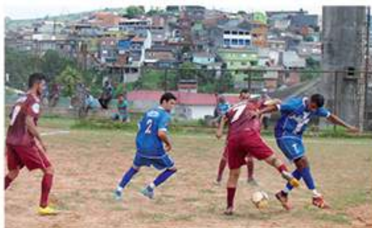
Itapeva x Vasco: bom jogo

As semifinais acontecem domingo (7) no campo do Itapeva. No primeiro jogo, às 9hs se enfrentam Mocidade x Maria Aparecida. No jogo de fundo às 10:30 Itapeva x Héliida medem forças.