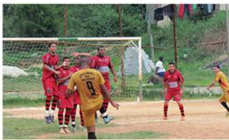
O Aguiar bateu o AACZ