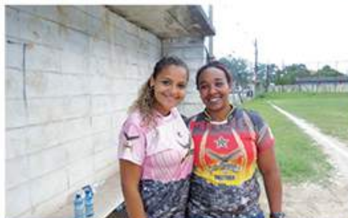
O Águia Magine inova com comissão feminina