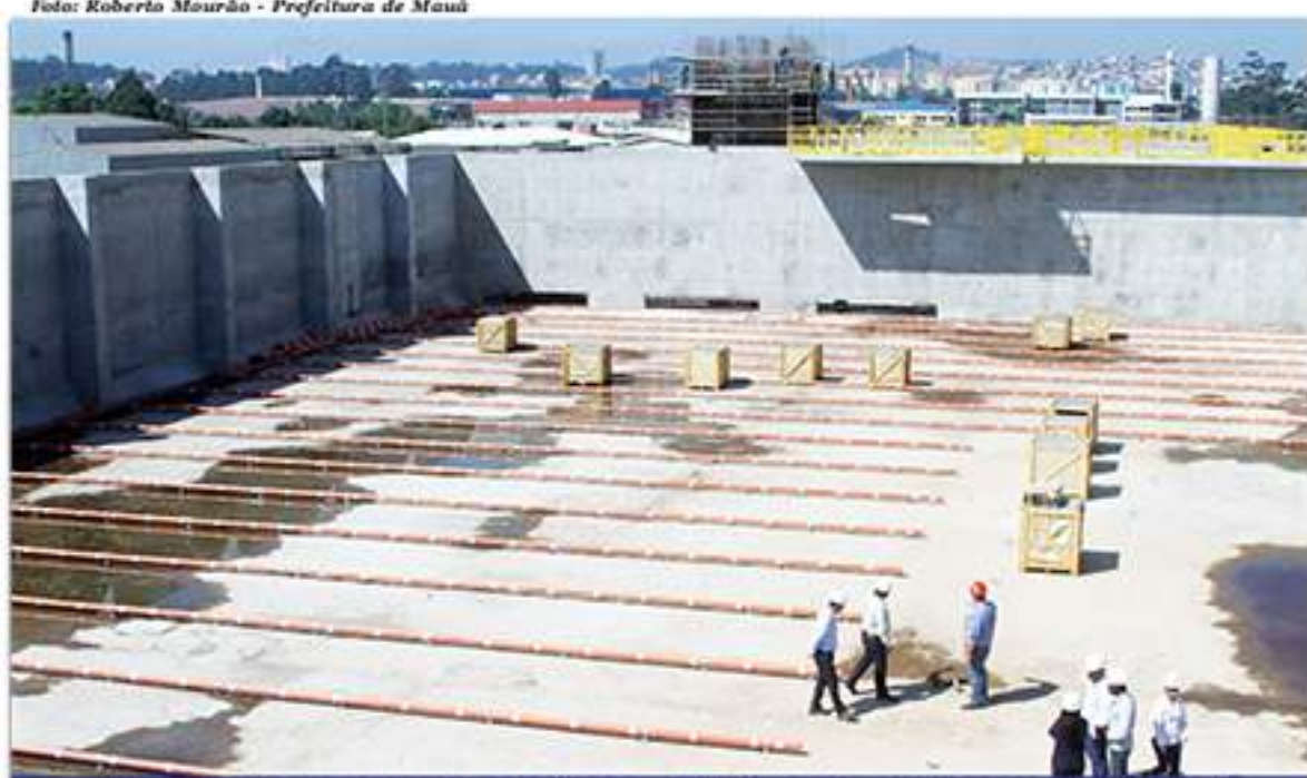
Estação de tratamento de água - ETE - será entregue no dia 8 de dezembro, data de aniversário de Mauá