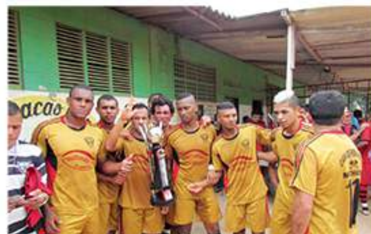
O AACZ também comemorou