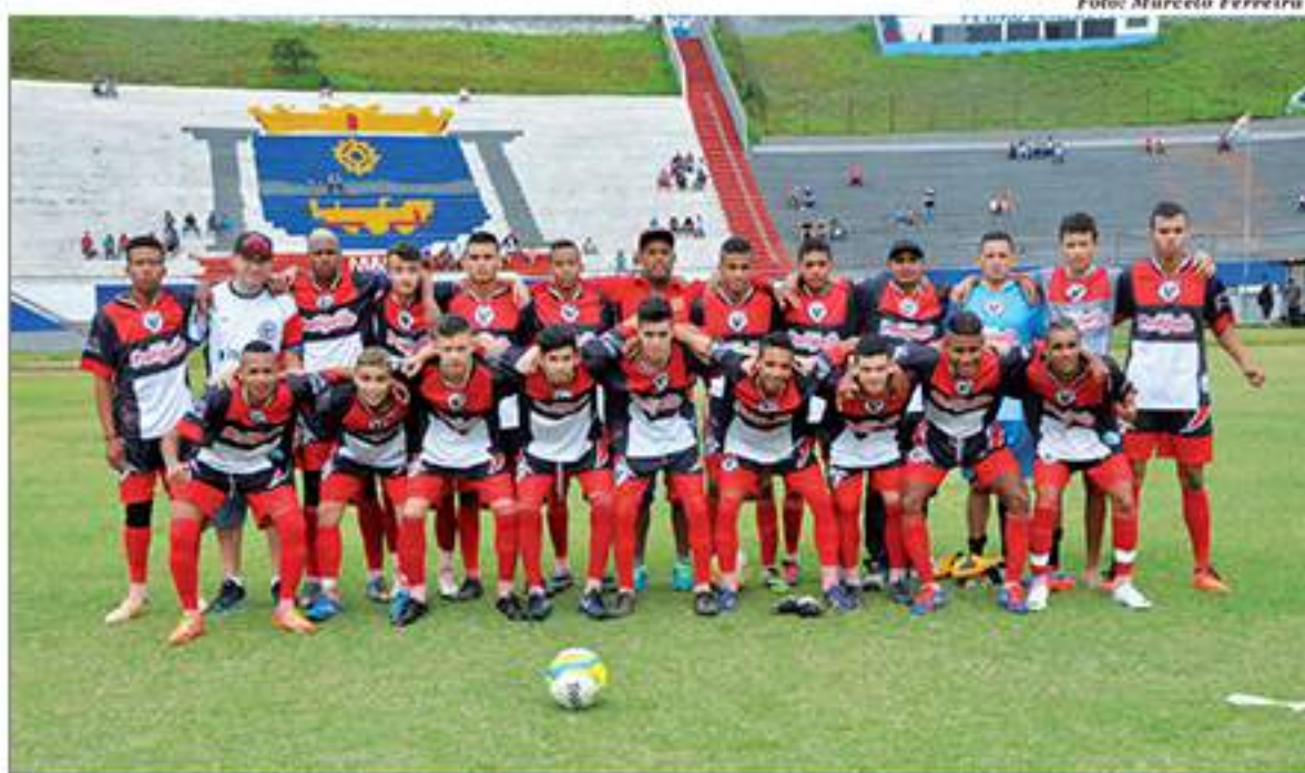
Após jogo equilibrado, Santa Rosa foi o campeão do sub-17