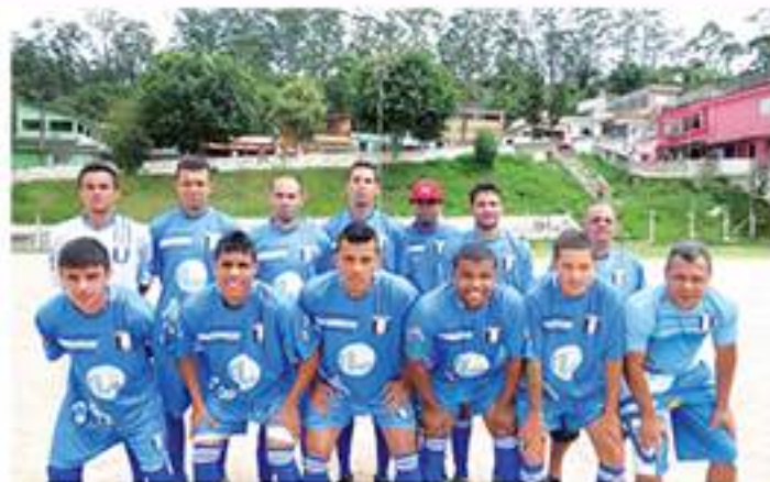
O Bocaina ganhou mais uma