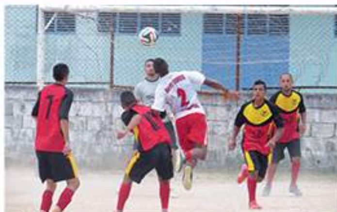
Águia Magine bateu o Santa Cruz por 1x0

Segunda etapa acontecerá só em 18 de janeiro