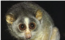
Lóris, animais típicos da Índia e do Sri Lanka, estão ameaçados de extinção

Em alguns lugares, eles se tornaram animais de estimação exóticos, apesar dos apelos de ambientalistas para que todos sejam recolocados em seus ambientes naturais. O caso mais grave aconteceu na Indonésia, onde muitas pessoas adotam lóris como animais de estimação.