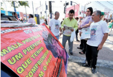
No início de agosto, moradores da cidade organizaram uma manifestação pedindo melhorias na saúde