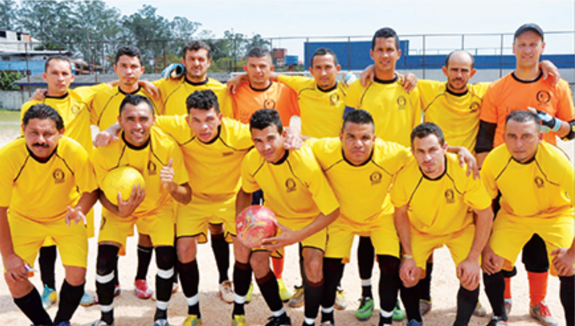
Equipe do Reunidos Zaíra, Série Prata

fase da competição, para a definição dos confrontos entre os classificados de cada um dos quatro grupos.