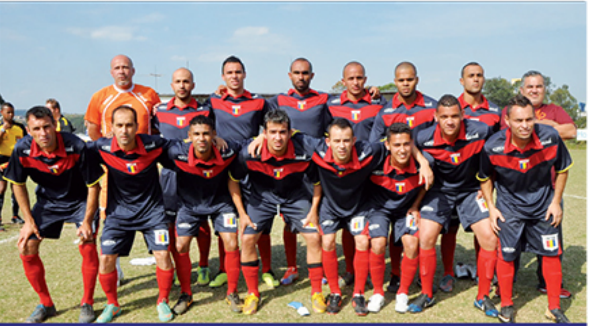
Seleção de Mauá jogou contra a seleção de São Caetano e empatou em 3x3