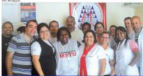
Ação de prevenção à saúde contou com vários testes e foi realizada no Jardim Primavera pela equipe do MSTU.