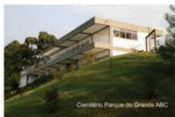
Cemitério Parque do Grande ABC

Não deixe de nos visitar, afinal, quem marca a sua vida não pode ser esquecido.