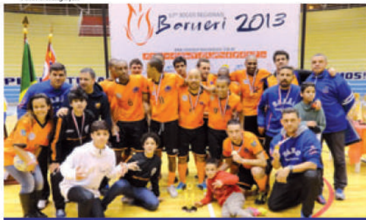
Resultados da delegação mauaense foram vistos como excelentes