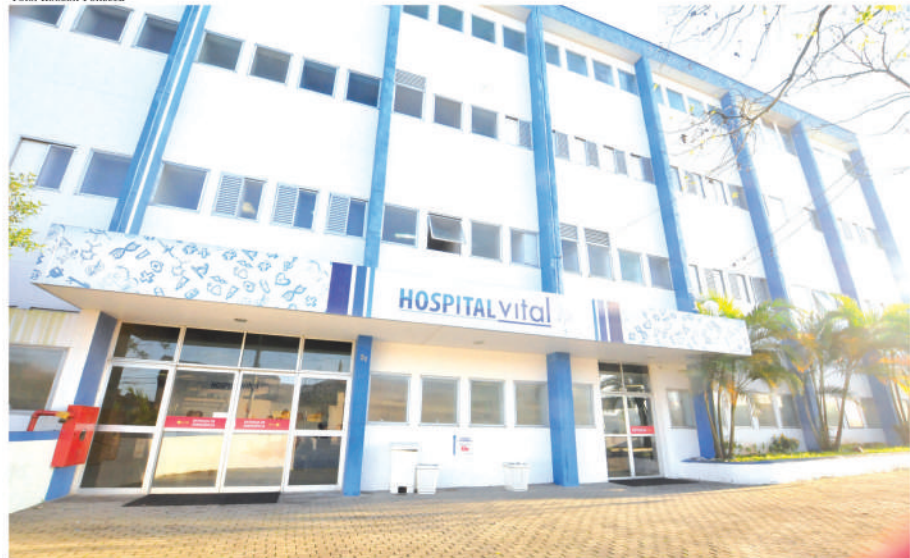
Hospital Vital está localizado na Vila Anchieta. Hospital atende a três especialidades e pronto-