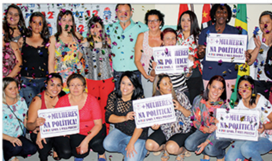
Mulheres do PDT se reuniram no último sábado