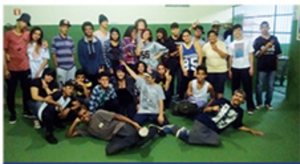
Projeto "Hip Hop Educa" quer levar cultura hip hop aos jovens de Mauá