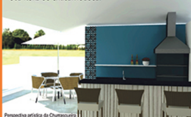
Perspectiva artística da Cozinha

Coberturas duplex também fazem parte dos itens de exclusividades.