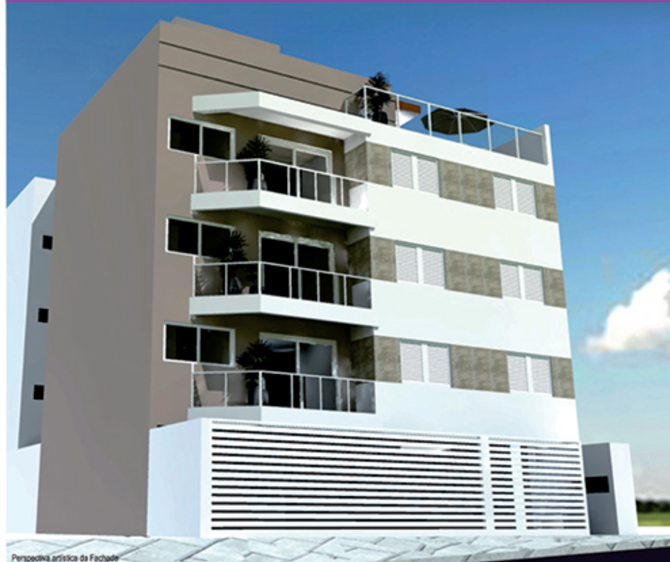
Perspectiva artística da Fachada

Um projeto exclusivo, com apartamentos 2 dorms/suíte, em um lugar tranquilo, gostoso de morar. Por um preço que vai surpreender você!