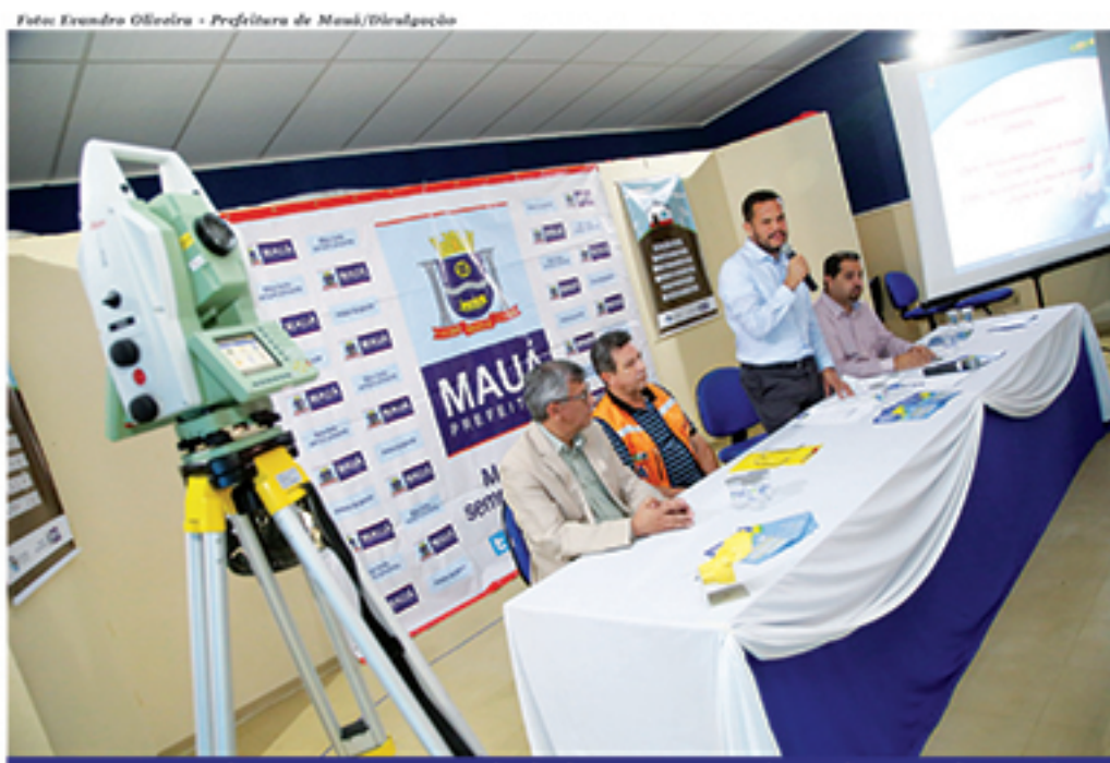
Sensores ajudarão na prevenção de deslizamentos em áreas de risco de Mauá

Desastres Naturais (Cemaden) em Mauá. Os equipamentos, que são fornecidos e monitorados pelo órgão vinculado ao Ministério da Ciência e da Tecnologia, em conjunto com a Coordenadoria de Defesa Civil, chega ao município por meio de convênio com a Prefeitura e atuarão no sentido de prevenir deslizamentos na cidade em época de chuvas. Mauá é a primeira de nove localidades no país a receber o projeto que tem uma Estação Total Robotizada, 150 prismas para reprodução de sinais de movimentação de terra e pluviômetros. Os sensores podem prevenir deslizamentos com até três dias de antecedência.