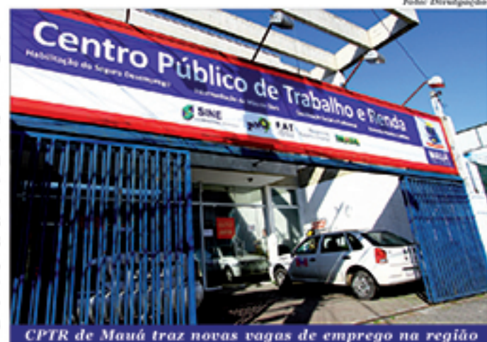
CPTR de Mauá traz novas vagas de emprego na região