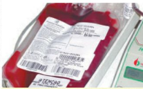
Pesquisa foi publicada no "American Heart Association Journal"