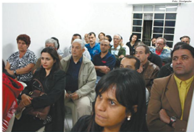
Comerciantes ouviram as propostas dos candidatos durante encontro