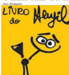
Lançamento do livro foi um sucesso