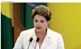
Apesar da pequena queda, Dilma continua com bom percentual de aprovação

nove de agosto, todas maiores de 16 anos. Além da queda na margem positiva, Dilma atingiu 30% na opção regular e 7% em ruim ou péssimo.