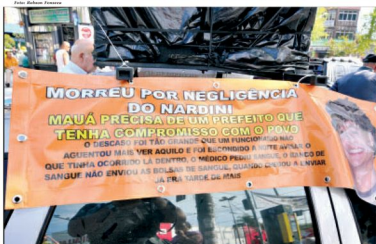
Objetivo da manifestação é conscientizar o próximo prefeito de que melhorias são necessárias na área da saúde