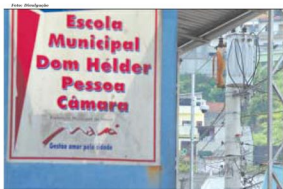
Escolas municipais de Mauá já possuem o sistema de monitoramento por vídeo

Sabemos que evitamos várias ocorrências. Temos êxito de furtos que foram identificados pelo sistema de monitoramento e