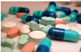
Medicamentos genéricos também cresceu em relação ao mesmo período em 2011

De acordo com a entidade, os associados regionais, que representam 22% na participação da distribuição dos genéricos, senti-