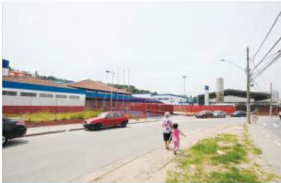
Com as câmeras, é possível acompanhar o que se passa no perímetro de prédios públicos

de Gestão Integrada, porque esse monitoramento também será integrado com as forças de segurança, como a polícia militar, a polícia civil. Elas estarão operando junto, através do Gabinete. E temos também ter observatórios de segurança. Então, hoje já temos implantados com recursos próprios do Gabinete de Gestão Integrada, o Observatório de Segurança e o espaço para a sala de vídeo monitoramento", revelou.