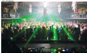
Baile do Dodô é um dos mais tradicionais de Mauá. Último baile de 2012 acontece neste sábado