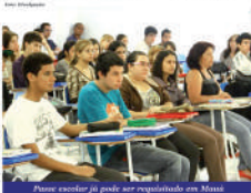
Passe escolar já pode ser requisitado em Mauá