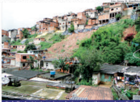
Trabalho de contenção em áreas de risco irá continuar sendo realizado

Esse valor será investido em obras de conten-