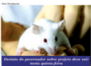
Decisão do governador sobre projeto deve sair nesta quinta-feira

O projeto prevê multa de mais de R$ 1 milhão por animal usado para a utilização que desrespeitar as novas regras. Para o profissional que não seguir as novas normas, o artigo prevê a de cerca de R$ 400 mil.