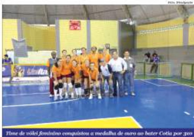
Time de vôlei feminino conquistou a medalha de ouro ao bater Cotia por 3x0

A equipe de malha também representou Mauá no pódio dos Jogos Regionais com a medalha de bronze, conquistada com uma expressiva vitória sobre a equipe de Jandira por 192 a 76. Na decisão,