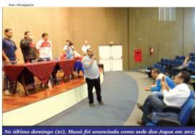
No último domingo (21), Mauá foi anunciada como sede dos Jogos em 2015