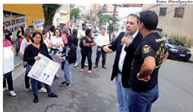
Para Atila, medida poderá prejudicar estudantes

"Muitos alunos do período noturno estão trabalhando e costumam passar