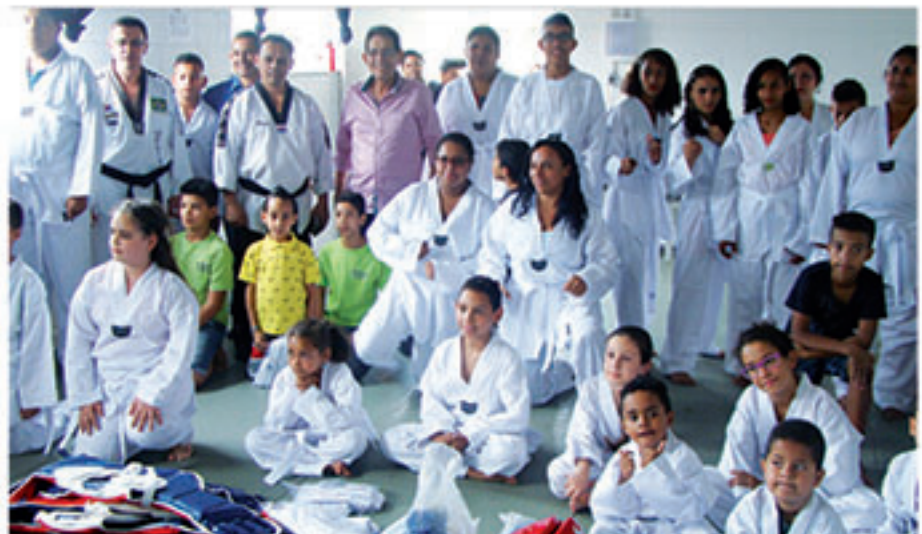
Os jovens taekwondistas do Zaira VI devidamente uniformizados