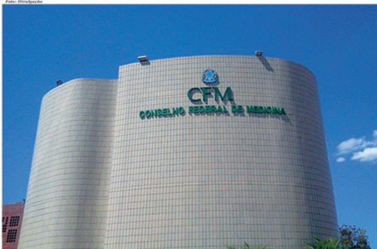
Pesquisa do CFM mostrou grande descontentamento da população brasileira com a saúde

de no Brasil como péssimos, ruins ou regulares. Segundo o estudo, que levou em consideração diversos fatores, o tempo de espera para ter acesso a um procedimento é o principal problema que afeta a qualidade dos serviços do SUS.