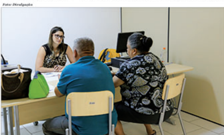
Pagamento de dívidas terá condições especiais neste período