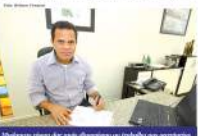
Mudanças estruturais de Mauá decorrem da mudança na estrutura das secretarias