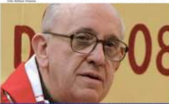
Novo Papa José Mario Bergoglio escolheu o nome Francisco