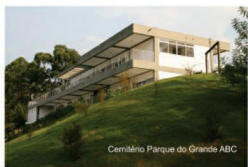
Cemitério Parque do Grande ABC

O grupo Cemitérios Associados, que também administra o Cemitério Parque das Garças em Santana de Parnaíba e conta com 19 anos de experiência, é a garantia de que sua família será amparada. Não deixe de nos visitar, afinal, quem marca a sua vida não pode ser esquecido.