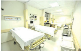
Hospital Vital possui estrutura com 90 leitos, entre apartamentos, enfermaria e UTI

der uma necessidade na região. O prédio foi totalmente modernizado e adequado para instalar um Hospital com capacidade para atender com conforto e eficiência. Foi uma força tarefa, multidisciplinar, um esforço de profissionais que creem no seu trabalho e em sua capacidade e