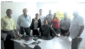
Reunião serviu para discutir sobre implantações de empreendimentos em Itaquaquecetuba