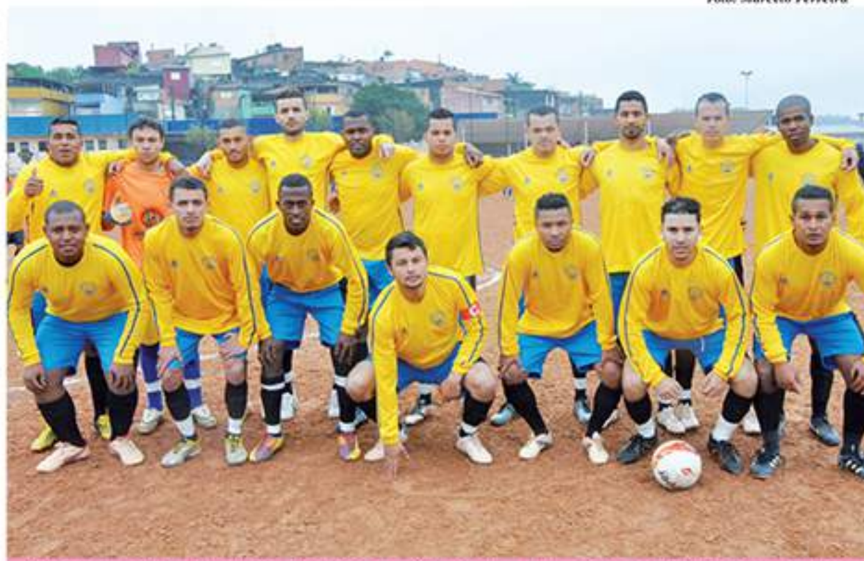
Equipe do Maria Aparecida, finalista da Série Ouro e garantida na Divisão Especial 2015

por 2x2. O resultado, além de lhe dar uma vaga na semifinal, garantiu-lhe o acesso à Divisão Especial. Mas faltava a vaga na grande final. E ela veio com uma vitória de 1x0 em um jogo duríssimo contra o Vila Tavares F. C.