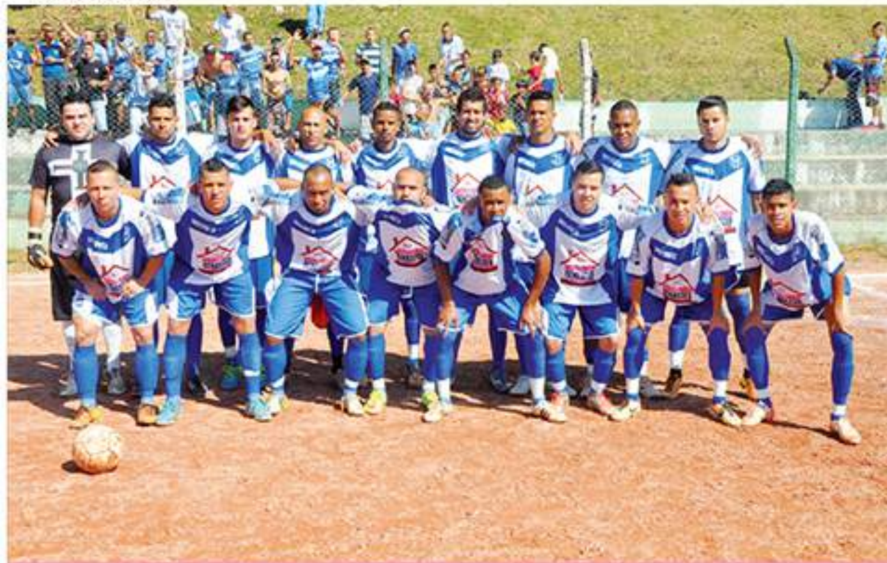
Equipe do Vera Cruz, finalista da Série Ouro. Também jogará a Divisão Especial em 2015