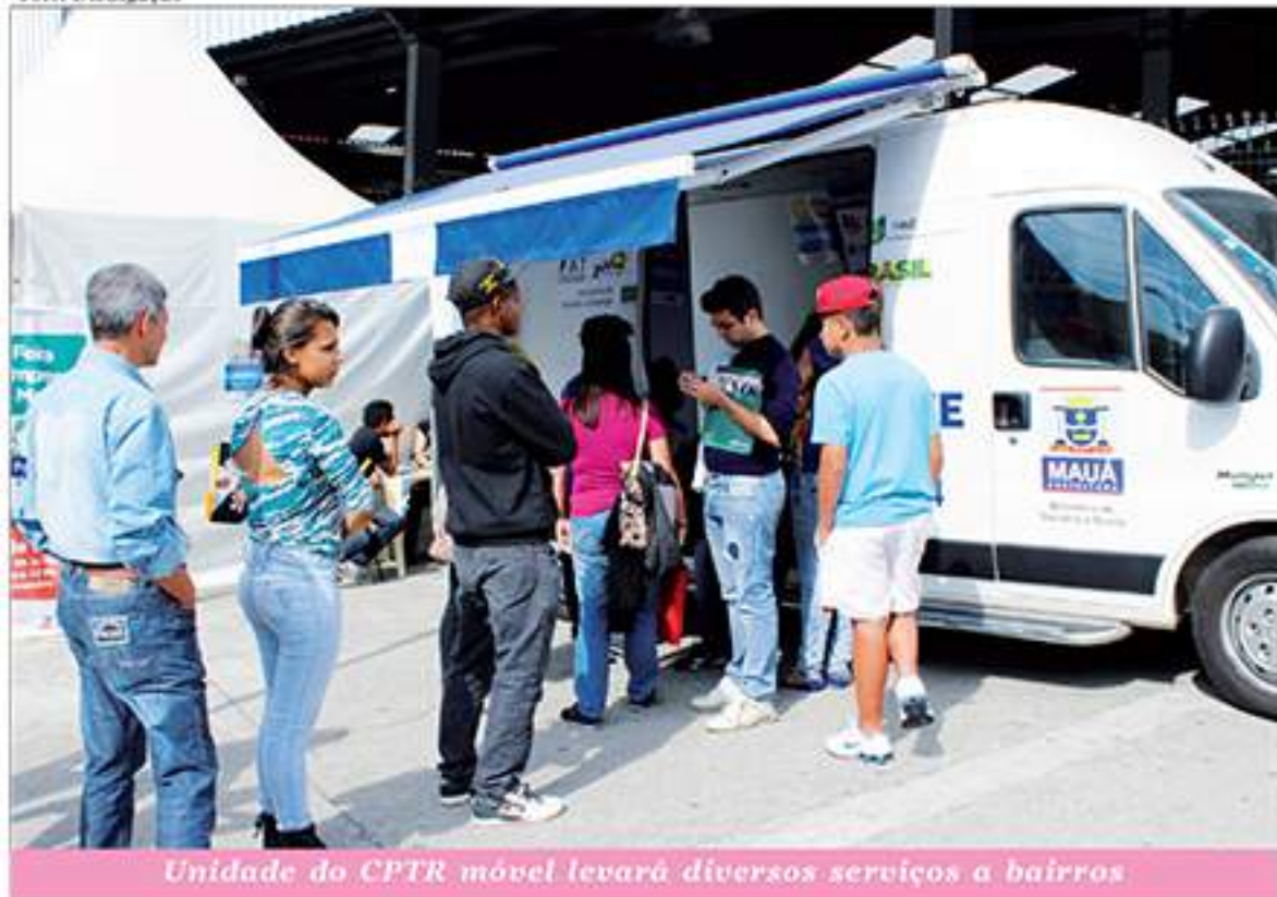
Unidade do CPTR móvel levará diversos serviços a bairros