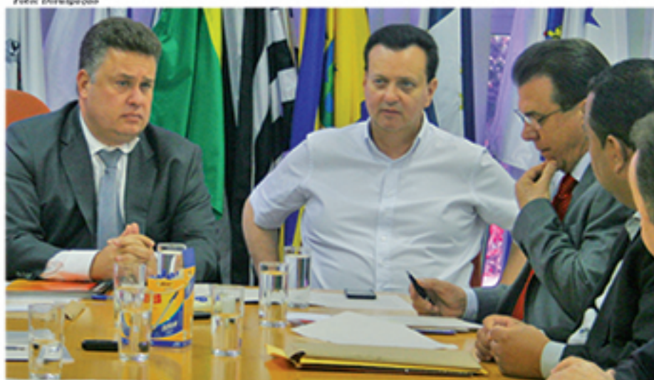
Prefeitos do ABC se reuniram com o ministro das Cidades Gilberto Kassab