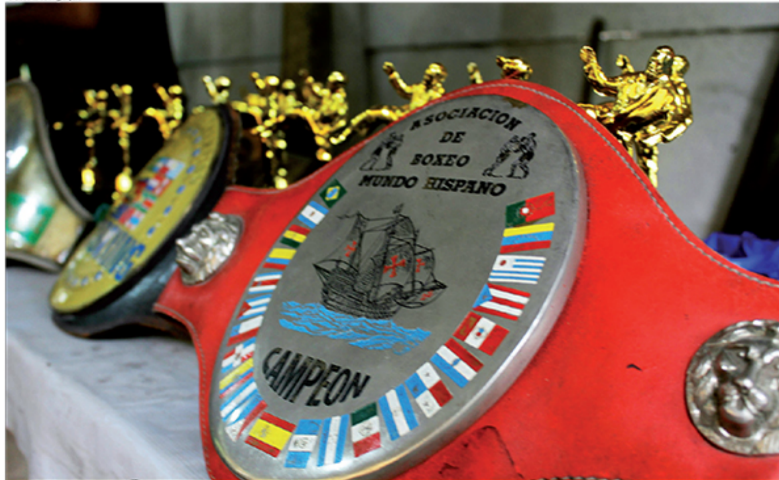
Aílton Pessoa coleciona títulos brasileiros e internacionais