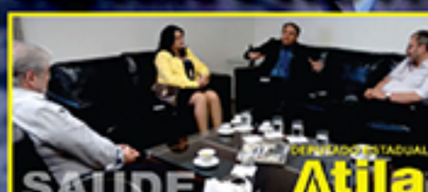
A Direção da Fundação ABC pede a ajuda do Deputado Atila para que junto ao Governo Estadual possa descentralizar e assim facilitar a distribuição de medicamentos de alto custo.

Alckmin estuda descentralizar farmácia de alto custo do ABC