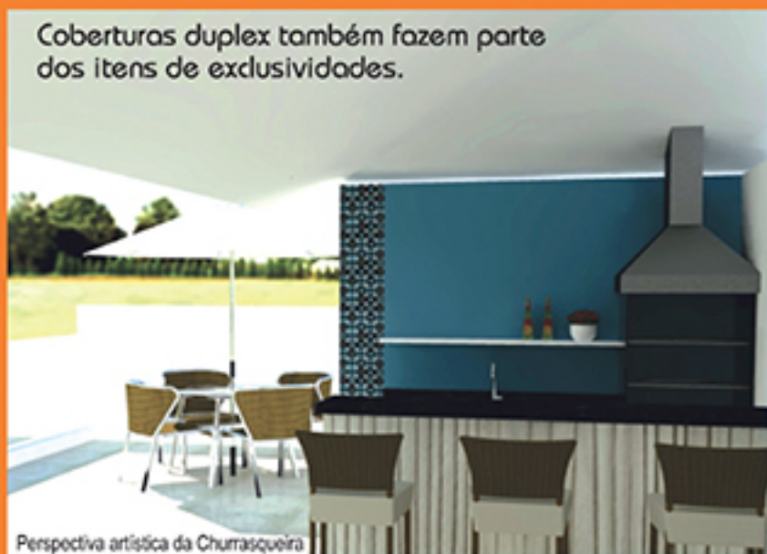
Perspectiva artística da Churrasqueira

Coberturas duplex também fazem parte dos itens de exclusividades.