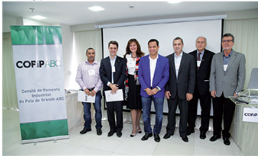
COFIP visa fortalecer o setor petroquímico na região