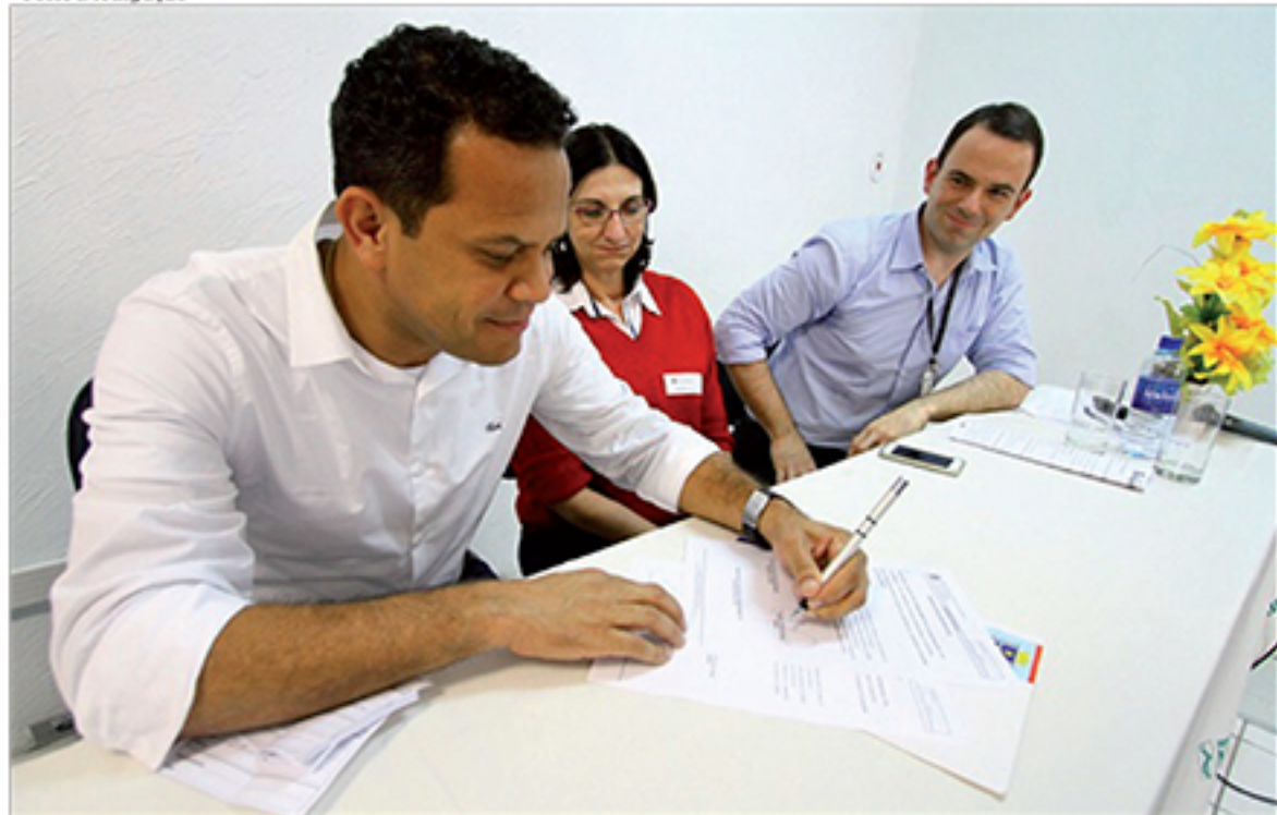
Reformas no primeiro andar do Hospital Nardini ocorrerá em etapas para não prejudicar o atendimento na unidade