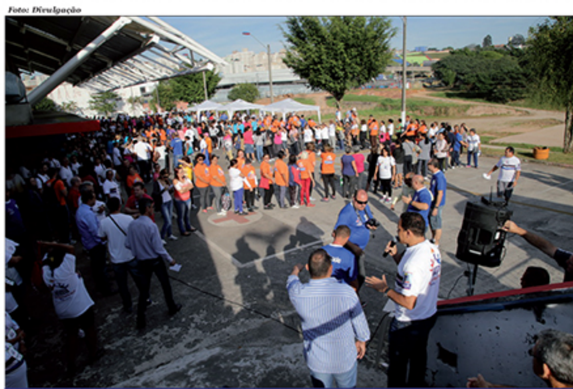
JOMI 2015 bateu recorde de inscritos com 620 atletas