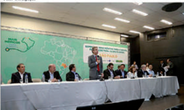
Profissionais cubanos do programa Mais Médicos terão reajuste em ajuda de custo em Mauá