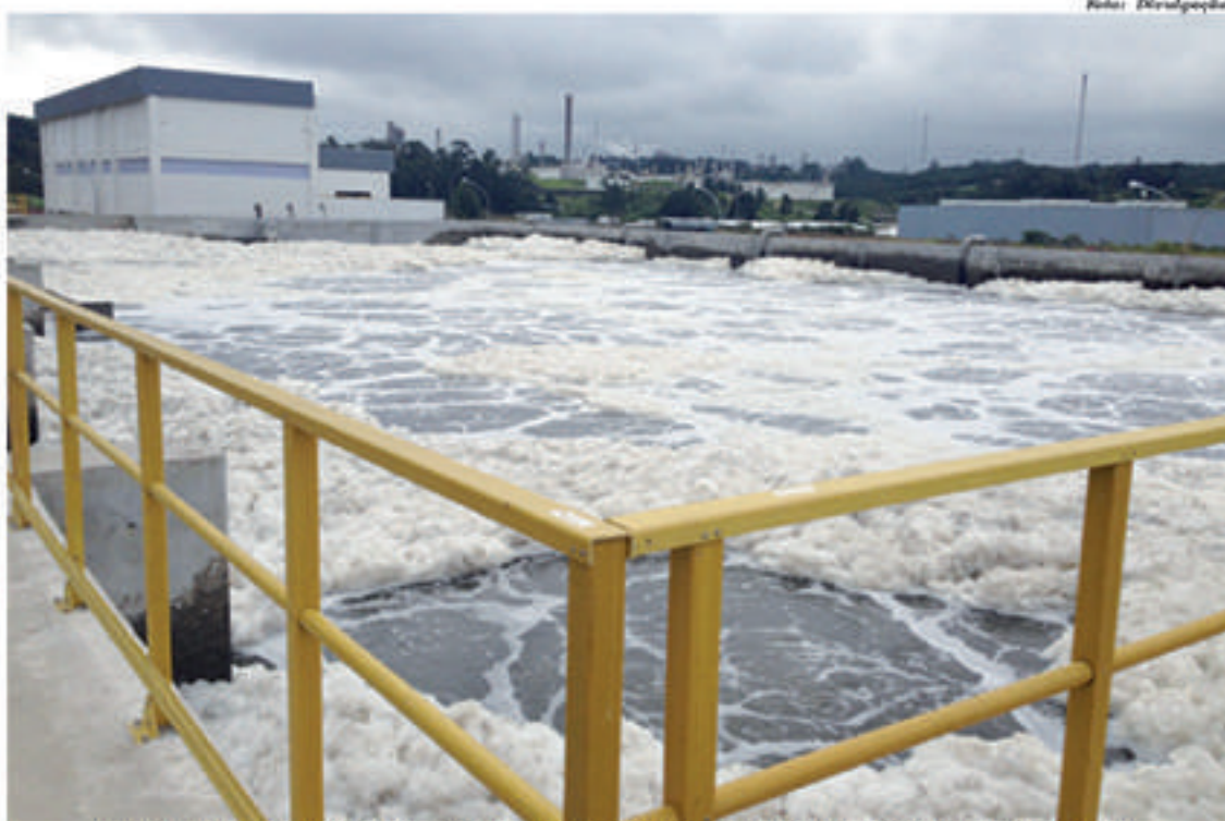
Aumento na tarifa de água e esgoto é devido a nova estação de tratamento

Procurada, a Odebrecht Ambiental reafirmou que o reajuste nas tarifas está amparado pelo decreto municipal nº. 7.996/14, que institui a cobrança desse serviço logo após o início de operação da