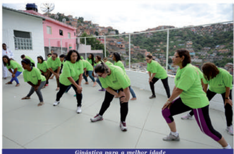
Ginástica para a melhor idade