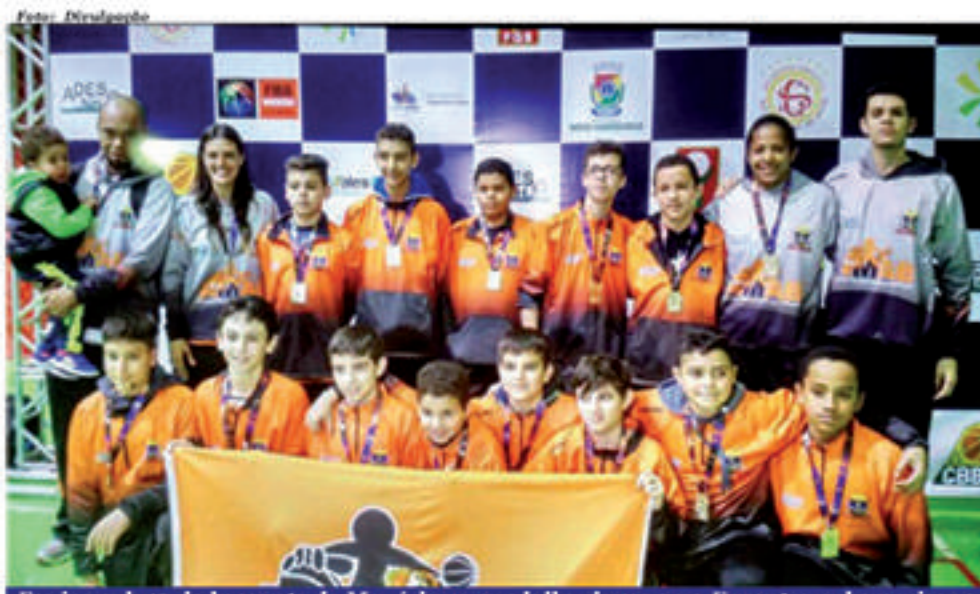
Equipe sub 12 de basquete de Mauá levou medalha de ouro no Encontro sul americano