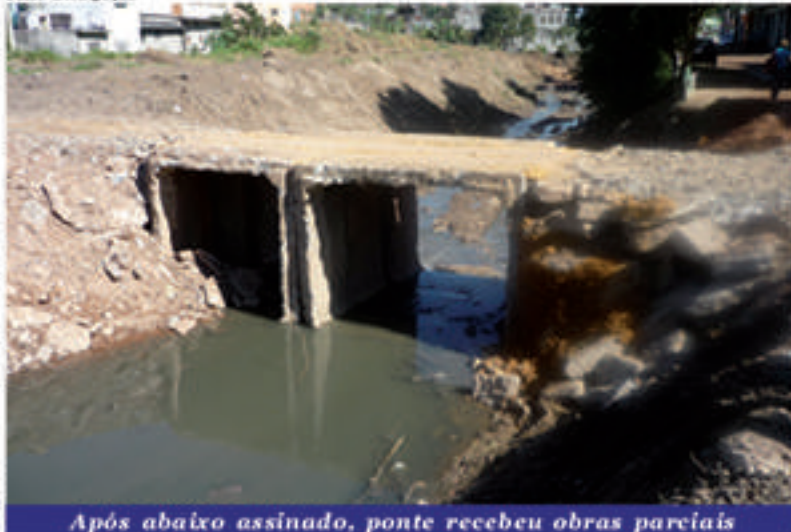
Após abaixo assinado, ponte recebeu obras parciais