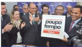
Governador Geraldo Alckmin anuncia construção de Poupatempo em Mauá

O Poupatempo de Mauá será de grande porte, com até 2 mil m 2 de área, e contará com mesas para atendimento, retirada de documentos, triagem, sala de espera e sala de funcionários, entre outros.