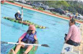
Clube do Judô, necessary especial do esporte em Mauá, acompanha aula

cando uma maior divulgação do esporte e novas praticantes. "Na Prefeitura, com o apoio da Associação dos Praticantes de Aventura, que é quem fornece os coletes (para as aulas) são os primeiros passos. Mas seria interessante que os clubes da cidade começassem a colocar aulas de canoagem em suas piscinas. Acho que a divulgação passa por isso. O importante é começar, e as