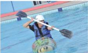
Primeiras turmas são formadas por alunos da natação e da hidroginástica. Ideia é expandir o projeto

o inverno, período em que o equipamento geralmente é fechado por conta das baixas temperaturas. Nessa primeira fase do projeto,