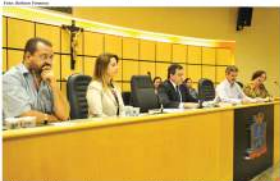
Audiência Pública sobre a situação dos animais.