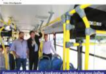
Empresa Leblon pretende implantar novidades em sua frota