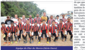
Equipe do Flor do Morro (Série Ouro)