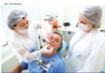
Laboratório atende por meio das Unidades Básicas de Saúde