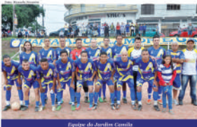
Equipe do Jardim Carilá

Outra importante competição do futebol amador de Mauá, a Série Ouro, dá seu pontapé inicial neste fim de semana. Contará com equipes divididas em seis grupos de 7 agremiações, o campeonato teve 18 jogos