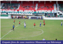
Empate fora de casa manteve Mauaense na liderança