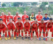
Equipe da América do Parque (Série Ouro)

Já a Copa Master iniciou sua segunda fase no sábado (17). Ao todo, 22 dos 26 times que iniciaram a competição seguem na disputa. Para a segunda fase, os clubes restantes foram divididos em dois grupos, com seis componentes cada. Os quatro melhores de cada chave seguirão para as quartas de final. No grupo A, o E. C. Santa Cruz e o C. A. Itapeva largaram na frente, vencendo suas partidas de estreia. O