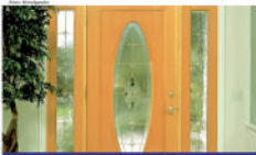
Cuidados com portas passam por sua pintura e manutenção