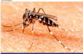
Agentes de saúde alertarão a população e irão procurar focos do mosquito Aedes Aegypti

Os melhores Ingredientes, O Melhor Sorvete.