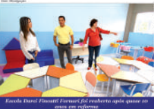
Escola Darci Fincatti Fornari foi reaberta após quase 10 anos em reforma