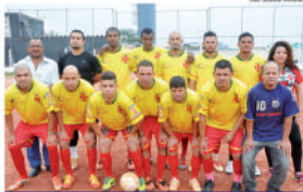
Equipe da Cruz de Malta

Pedrotrês F. C. A. D. Vinçopolis e o Moxidale F. C. ainda sorriam com uma vaga. O Moxidale ainda luta para não ser o pior sétimo colocado. Já a A. A. Bela Vista, que não precisava desta edição, já foi rebaixado. O grupo C segue sendo o mais equilibrado da Divisão Especial 2014. Os dois líderes da chave, o Belenense F. C. e o C. A. Itapeva, amba