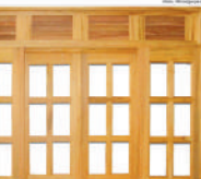
Exposição ao sol ou a chuva pode estragar janelas de madeira

Uma outra precaução que precisa ser adotada é com relação aos cuidados para que não haja batidas das portas e das janelas. O fechamento abrupto delas pode causar trincas na pintura e também