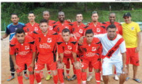
Equipe do América

Já no grupo C, três equipes já disputam na liderança com seis pontos cada. Agóvener em seus jogos de estreia o C. A. Baperu, o Belenense F. C. e o Colônia F. C. voltaram