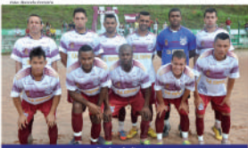
Equipe do Baperu

No grupo B, o destaque neste início de campeon-