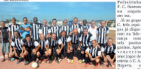
Equipe Master do Parque das Américas