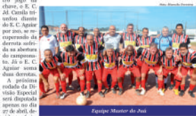
Equipe Master do Juiá