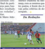
Mauauense conseguiu empate no fim com a Portuguesa Santista